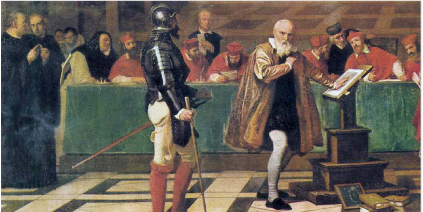
Fig. a. Galileo Galilei di fronte al tribunale dell'Inquisizione in un dipinto di Robert Fleury, Museo del Louvre.

Riportiamo qui di seguito un brano del Dialogo sopra i due massimi sistemi , l'opera con cui Galileo Galilei impose alla tradizione di pensiero aristotelica il nuovo pensiero scientifico.