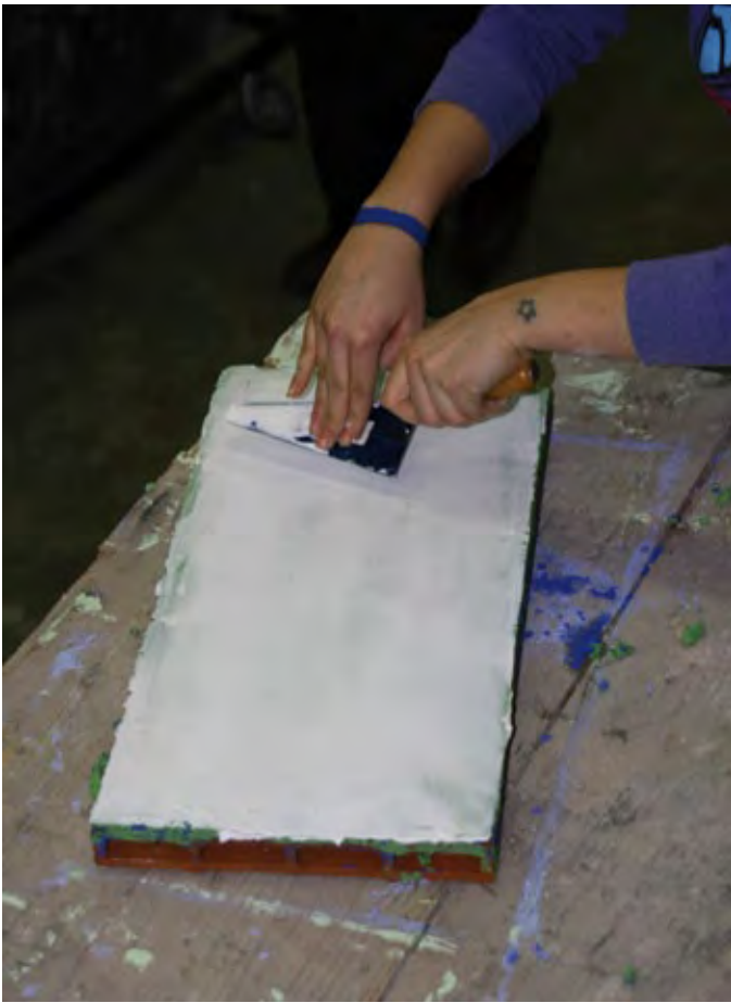
7 - Spianatura del grassello con la cazzuola.