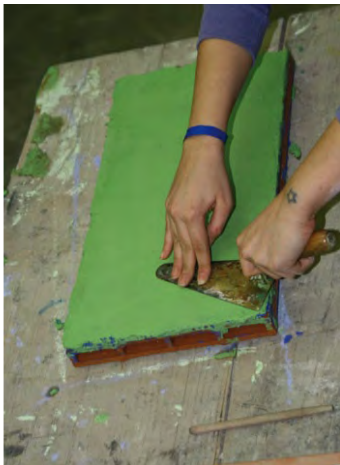
5 - Pressatura dello strato d'intonaco con la cazzuola e rimozione dai bordi dell'eccesso di materiale.