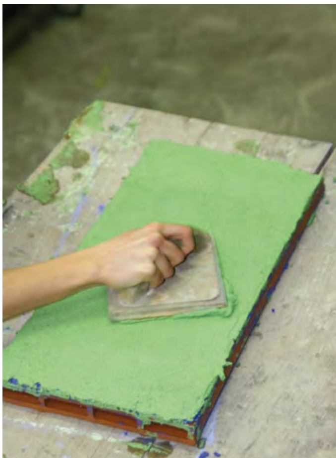
4 - Spianatura dell'intonaco con il frattazzo.