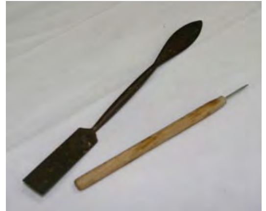
Punta e raschietto.