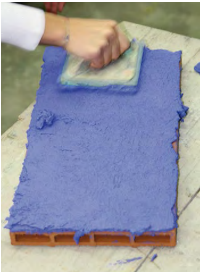
2 - Spianatura dell'intonaco con il frattazzo piccolo.