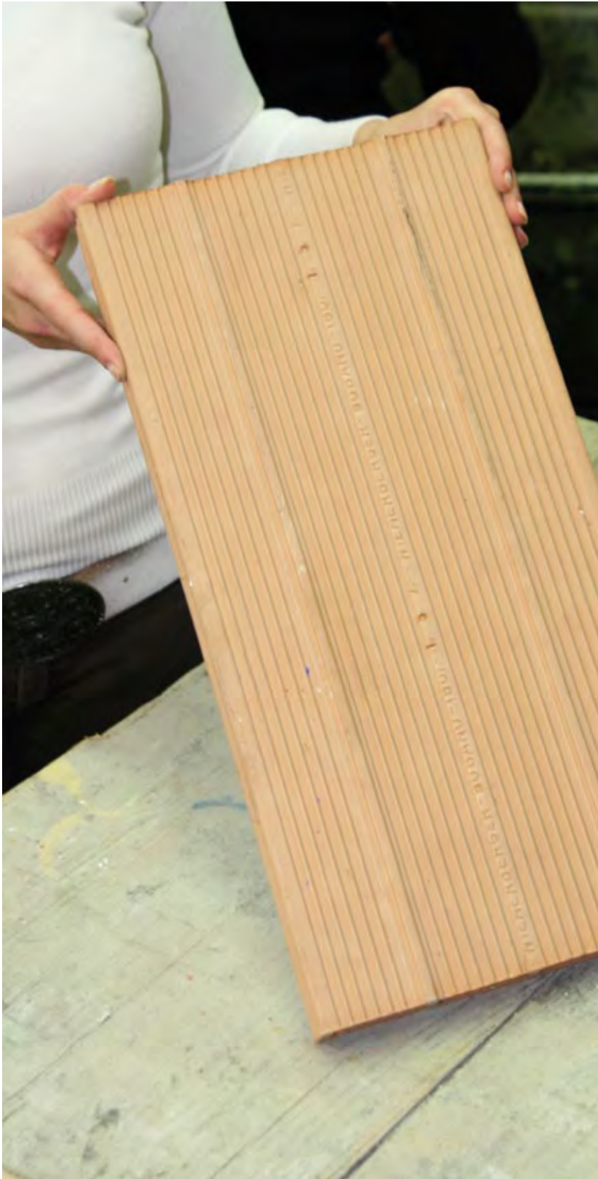
Tavella in cotto, per esercitazione.