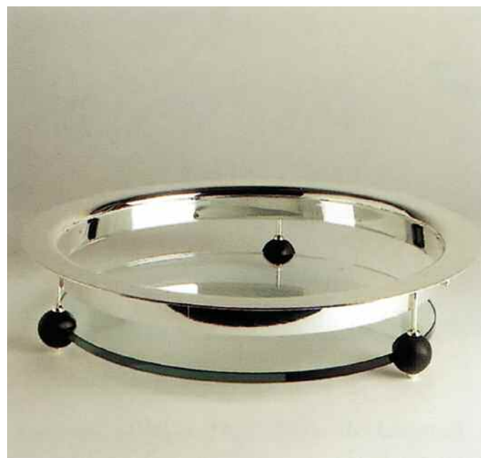
A sinistra: Wilhelm Wagenfeld, Contenitori Kubus, 1938.