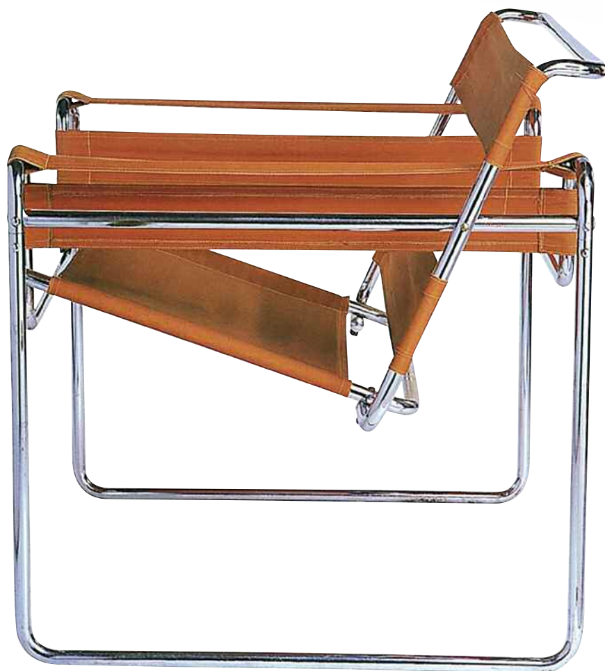
Marcel Breuer, Poltrona Vasilij, 1925. Tubo cromato e pelle. 70x79x72 cm. Bruxelles, Museo d'Ixelles.