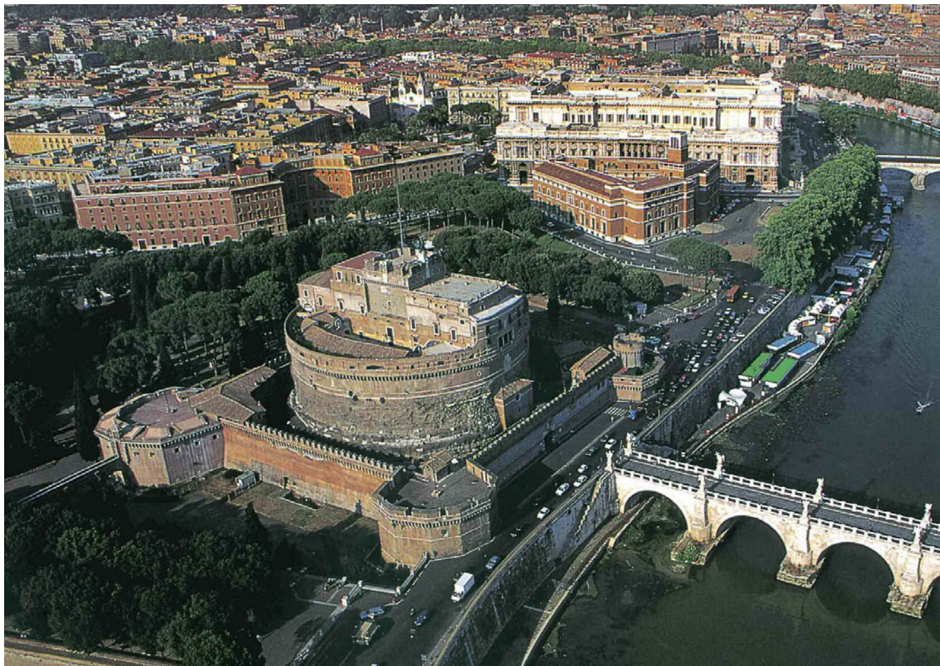
Veduta (sopra) e modello ricostruttivo (a lato) del Mausoleo di Adriano, a Roma, oggi Castel Sant'Angelo. 130-140 d.C.