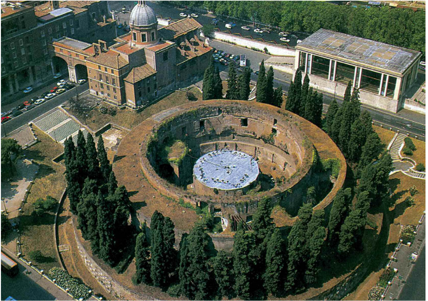
Veduta (sopra) e pianta (sotto) del Mausoleo di Augusto.