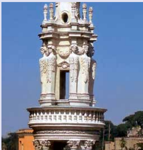
Francesco Borromini, Campanile di Sant'Andrea delle Fratte , 1653-1665. Roma.