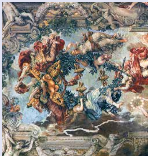
Pietro da Cortona, Trionfo della Divina Provvidenza , 1633-1639. Roma, Palazzo Barberini.