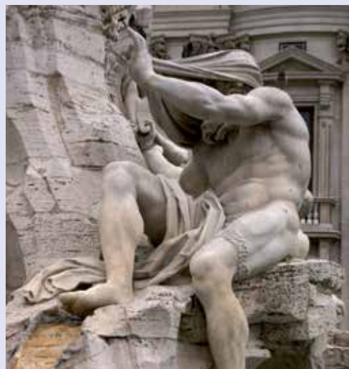
Gian Lorenzo Bernini, Fontana dei fiumi a Roma , 1648-1651. Particolare del Nilo.

Roma raggiunge nel XVII secolo una nuova fase di grande splendore e orienta la maggior parte del suo impegno in campo artistico per rafforzare il proprio ruolo sulla scena internazionale.