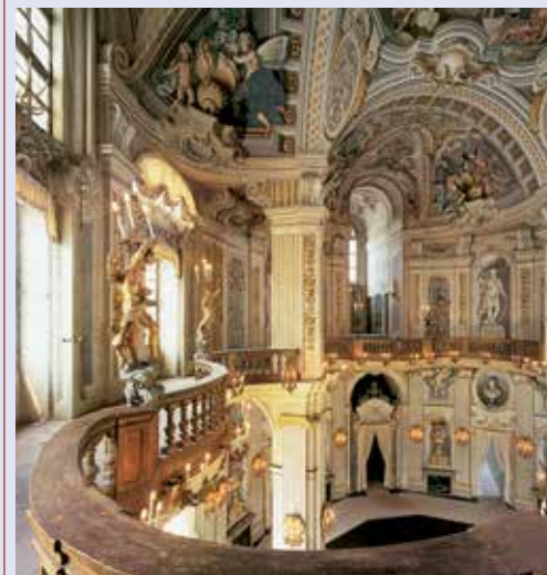
Filippo Juvarra, Palazzina di caccia di Stupinigi , 1729-1731. Veduta dell'atrio.

La luce assume un'importanza fondamentale per creare effetti coinvolgenti, in tutte le arti. In architettura si studia la distribuzione degli spazi in funzione della luce, con zone in cui essa è radente (cioè laterale) ed altre in cui è molto concentrata e abbagliante. Diversamente da quanto avveniva nel Rinascimento, ora la luce serve a produrre illusioni , a 'confondere' sulle reali distanze delle cose rappresentate, ma anche a mostrare la ricchezza stupefacente della realtà. Molto importante è la lezione di Caravaggio: egli ha inteso la luce come strumento per rivelare la presenza di Dio tra gli uomini, squarciando il buio.