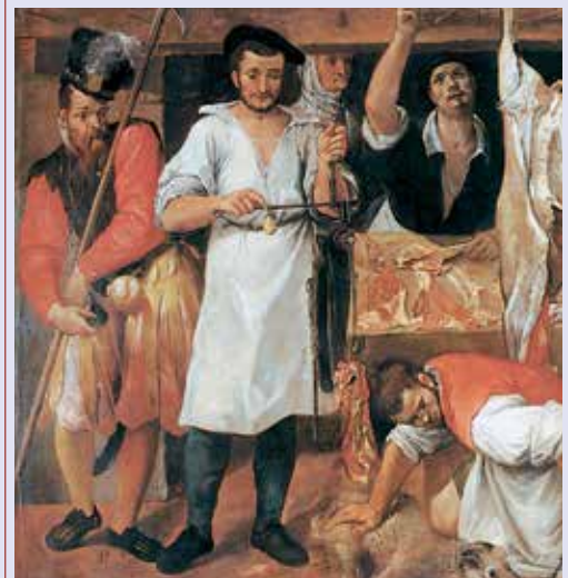
Annibale Carracci, La bottega del macellaio , 1585 circa. Olio su tela, Oxford, Christ Church Picture Gallery.

L'uomo, dunque, si trova di fronte a un mondo sempre più affascinante e sorprendente, che stimola la sua immaginazione.