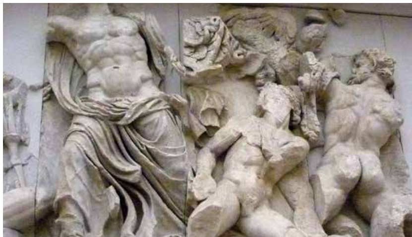
Firòmaco, particolare della Gigantomachia con le figure di Zeus e Porfirione, sul fianco orientale dell'Altare di Pergamo.