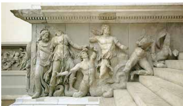
1. Firòmaco, particolare del fregio sul fianco occidentale della scalinata dell'Altare di Pergamo, raffigurante le divinità marine che hanno combattuto al fianco di Zeus contro i Giganti.

Importanti templi furono eretti e dedicati alle divinità classiche, mentre la città e i monumenti si dotarono di splendide statue in bronzo e in marmo.