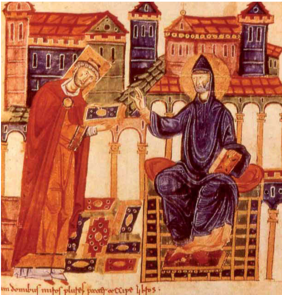
L'abate di Montecassino, Desiderio, presenta l'evangelario a San Benedetto, Biblioteca apostolica vaticana, 1070.

da Leone Ostiense, La Cronaca di Montecassino , III, 26-27