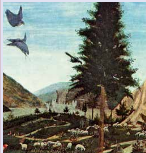
Domenico Veneziano, Adorazione dei Magi , part., 1438-1441. Berlino, Gemäldegalerie.