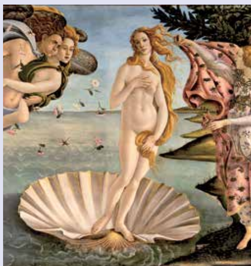
Sandro Botticelli, Nascita di Venere , 1483-1485. Firenze, Galleria degli Uffizi.

Nel desiderio di imitare la realtà, l'artista cerca delle regole che gli consentono di rappresentare lo spazio e gli oggetti in modo tridimensionale . Viene così elaborata la prospettiva , metodo grafico basato sulla geometria. Questa riesce a dare l' illusione della profondità sulla superficie piana del dipinto, a calcolare i corretti rapporti di proporzione tra le figure e il progressivo diminuire dei corpi a mano a mano che si allontanano dal primo piano. La prospettiva era già stata usata dagli antichi Romani e poi da Giotto, anche se in modo intuitivo, ma solo nel Quattrocento ha avuto una definizione teorica .