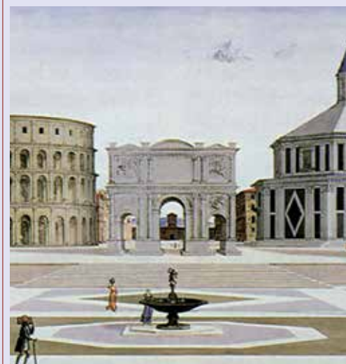
Artista dell'Italia Centrale, Città ideale . Baltimora (Stati Uniti), The Walters Art Museum.

Importante, poi, è il recupero dei soggetti mitologici : vengono ripresi i miti pagani e le divinità che popolavano l'Olimpo classico, anche se con nuovi significati, coerenti con il pensiero cristiano.