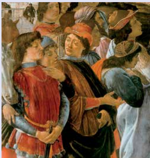
Sandro Botticelli, Adorazione dei Magi , part., 1475. Firenze, Galleria degli Uffizi.