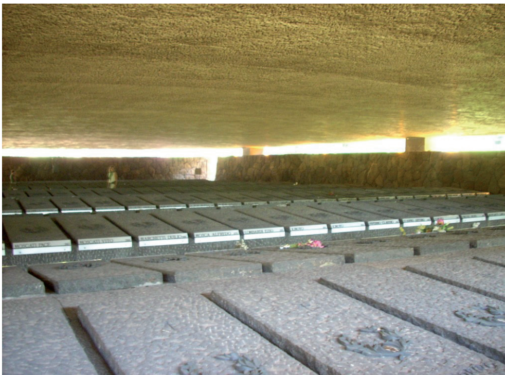
Il monumento in ricordo delle vittime dell'eccidio.

di giudizio, ebrei romani e alcuni giovani. I cinquanta detenuti che mancavano per raggiungere il numero prefissato vennero richiesti al questore di Roma.