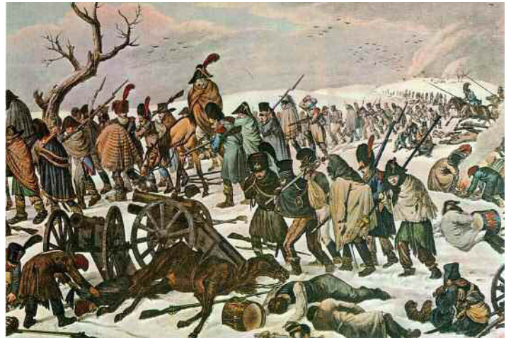
La drammatica ritirata da Mosca delle truppe francesi.