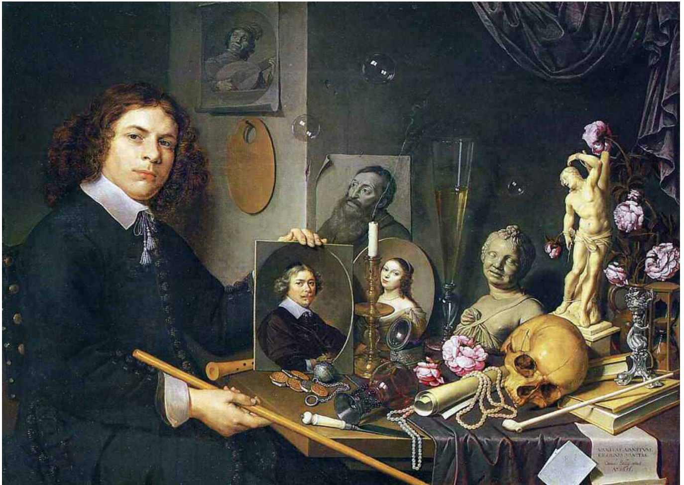
David Bailly, Autoritratto con simboli di vanità , 1651. Leida, Stedelijk Museum.