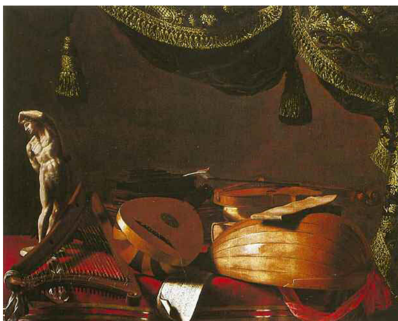
In alto: Pieter Claesz, Vanitas , 1630. L'Aia, Mauritshuis.

Questo ventaglio simbolico attraversa l'immaginario culturale italiano ed europeo per secoli e trova espressione in moltissime opere di tanti artisti, fra cui quelli della Scuola della Vanitas di Leida (David Bailly, i fratelli Steenwyck), quella di Harlem (Pieter Claesz, Clara Peeters), la tradizione spagnola (Antonio de Pereda, Valdes Leal, Andres de Leejto, Antonio Ponce), la scuola francese (Jacques Linard, Reinardh Simon de Saint André) e quella italiana (Salvator Rosa, Evaristo Baschenis).