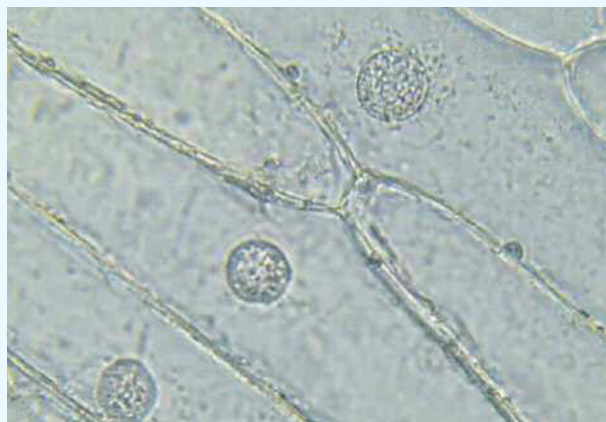
Fig. 1. Cellule di epidermide di cipolla osservate al microscopio ottico.

Le cellule vegetali sono mediamente molto più grandi delle cellule animali. Esse, come le cellule animali, sono delimitate da una membrana cellulare (non visibile al microscopio ottico), ma in più possiedono una parete cellulare (che circonda la membrana cellulare) molto spessa, fatta essenzialmente di cellulosa, solitamente ben visibile al microscopio ottico (a forte ingrandimento).