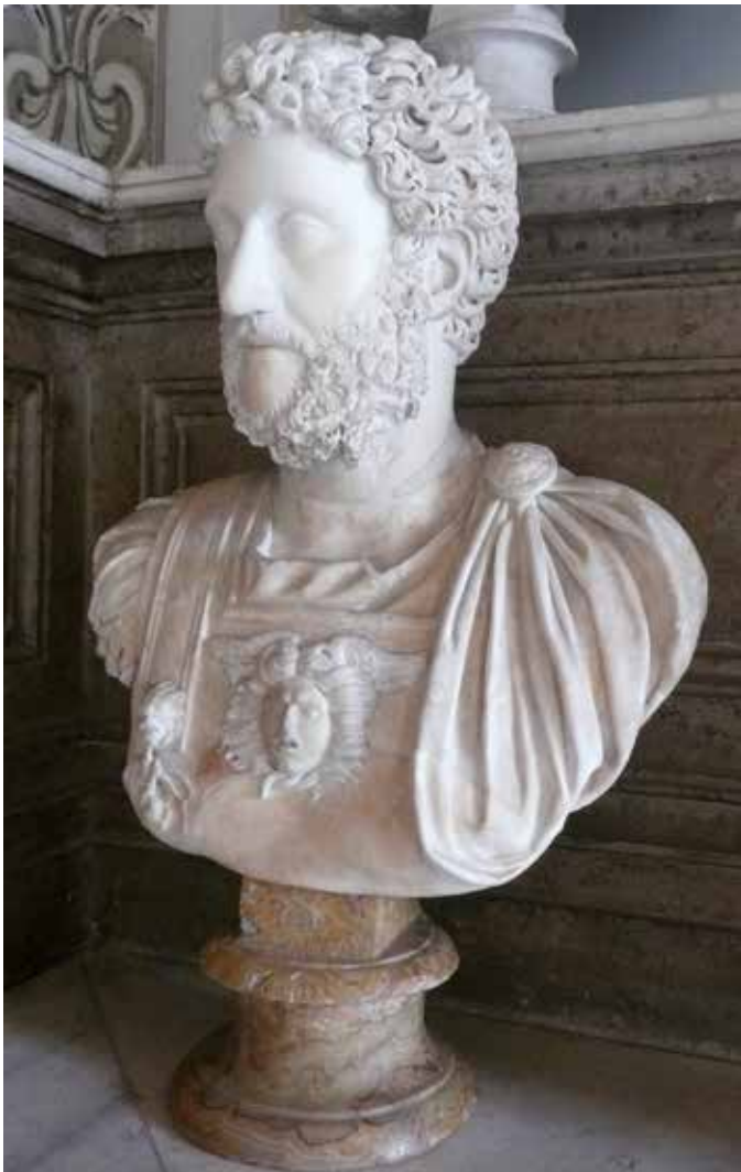
Ritratto ufficiale di Commodo. Roma, Musei Capitolini.