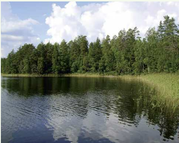
Fig. 1. Il lago potrebbe essere un ottimo ambiente di raccolta per questa esperienza.