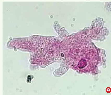
Fig. 2. (a) Fotografia al microscopio ottico e disegno schematico di ameba (b).