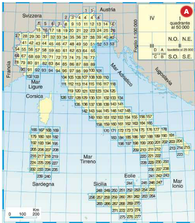
Fig. A. Quadro di unione dei fogli (scala 1 : 100 000) della Carta topografica d'Italia.

■ COME È ORGANIZZATA LA CARTA TOPOGRAFICA D'ITALIA. Si tratta di un documento che, nella sua forma classica, consiste di 277 carte, dette fogli , in scala 1:100 000. Tali fogli sono numerati da 1 a 277 (più altri 8 numerati a parte, per un totale di 285) (fig. A).