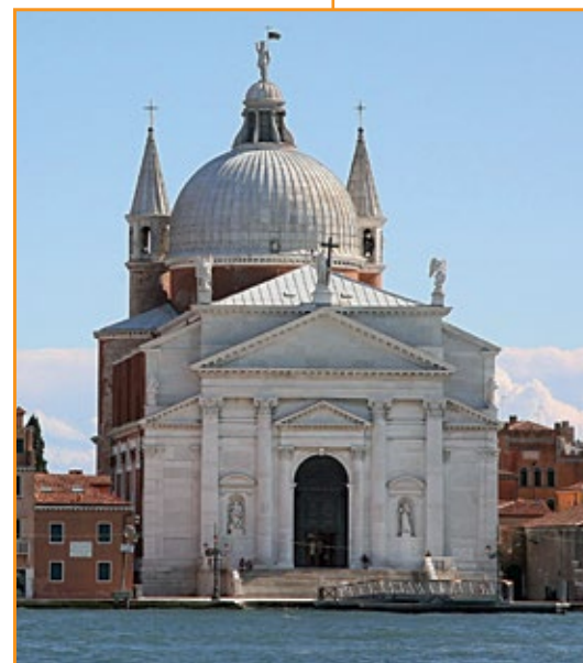
Palladio, Chiesa del Redentore , 1577. Venezia.