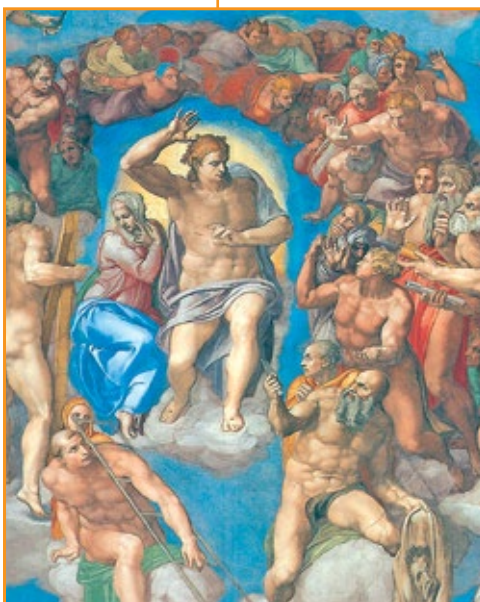
Michelangelo, Giudizio universale , 1536-1541. Roma, Cappella Sistina.