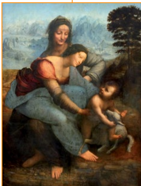
Leonardo, Sant'Anna, la Vergine e il Bambino con l'agnello , 1510.