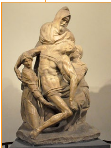
Michelangelo, Pietà Bandini , 1550.