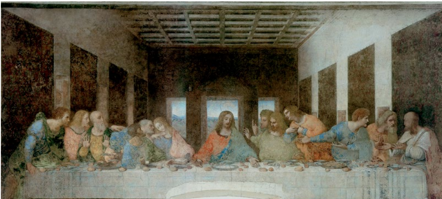
Leonardo da Vinci, Il Cenacolo , 1495-1497. Tempera e olio su intonaco, 460x880 cm. Milano, Refettorio di Santa Maria delle Grazie.