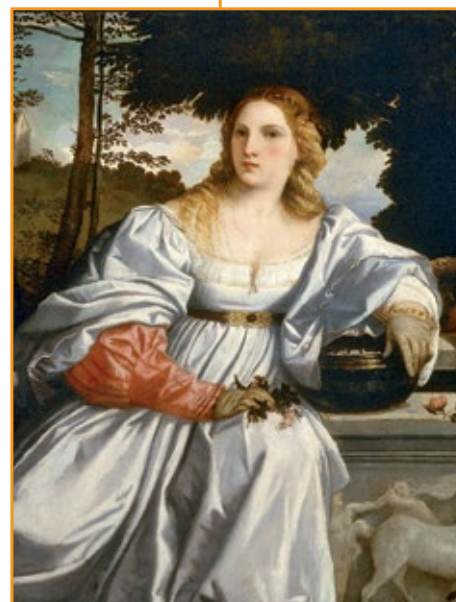
Tiziano, Amor Sacro e Amor Profano , 1516.