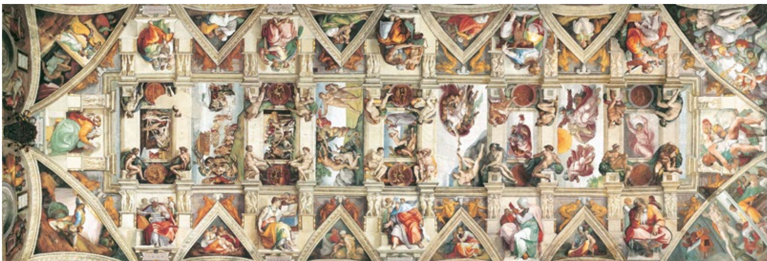
Michelangelo, Volta della Cappella Sistina , 1508-1512. Affresco, 13x36 metri. Città del Vaticano.

La figura umana viene idealizzata. Le figure sono legate da un intreccio di espressioni e di relazioni armoniche. Nel Manierismo , nuove e raffinate soluzioni formali esprimono la crisi dei valori rinascimentali.