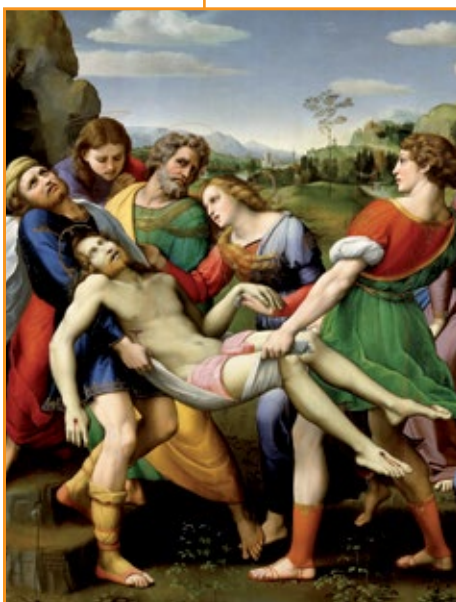
Raffaello, Deposizione , 1507.