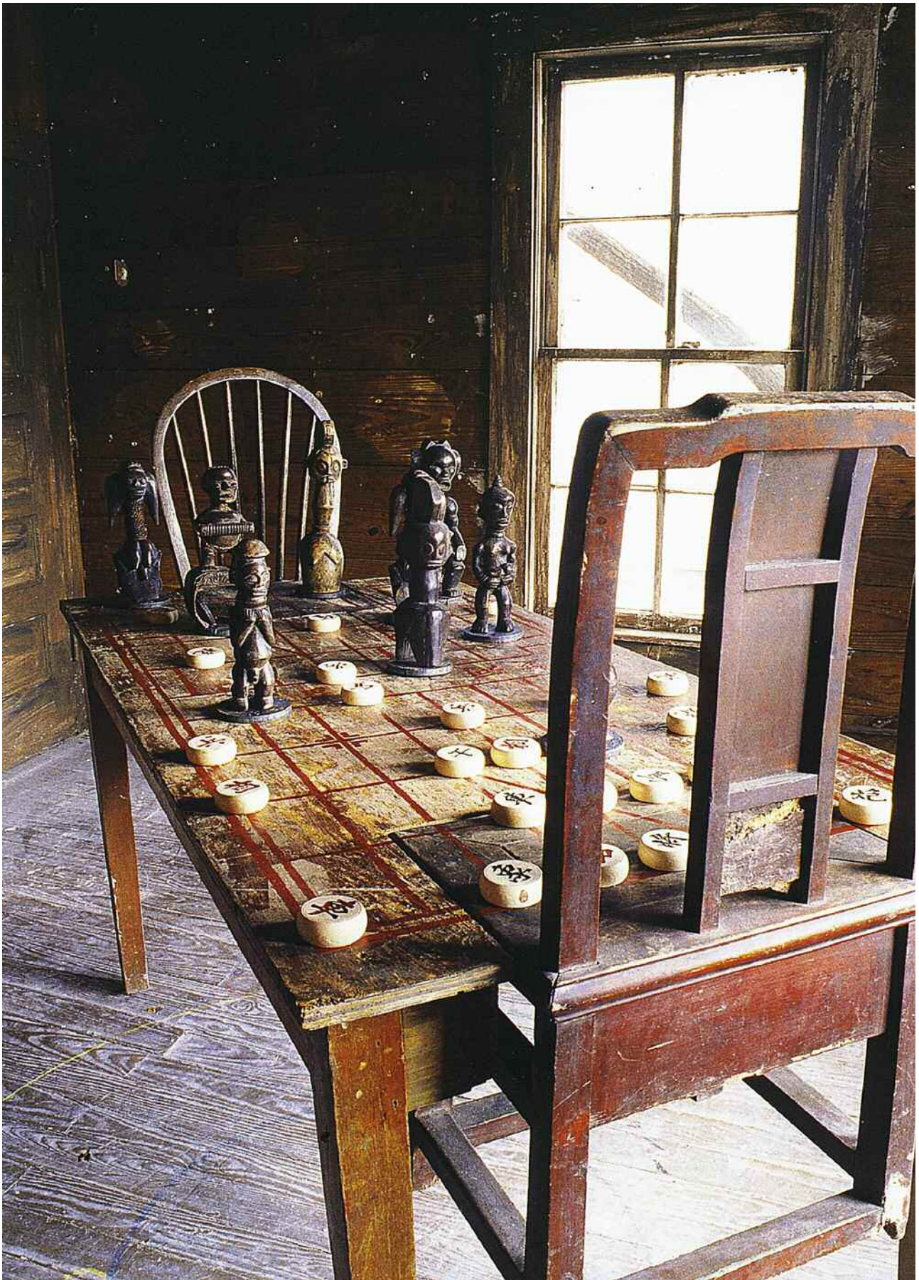
Chen Zen, Couldn't Bananas be Black?, 1999. Legno, sedie, statuette africane, scacchi cinesi. Galleria continua, San Gimignano-Beijing.