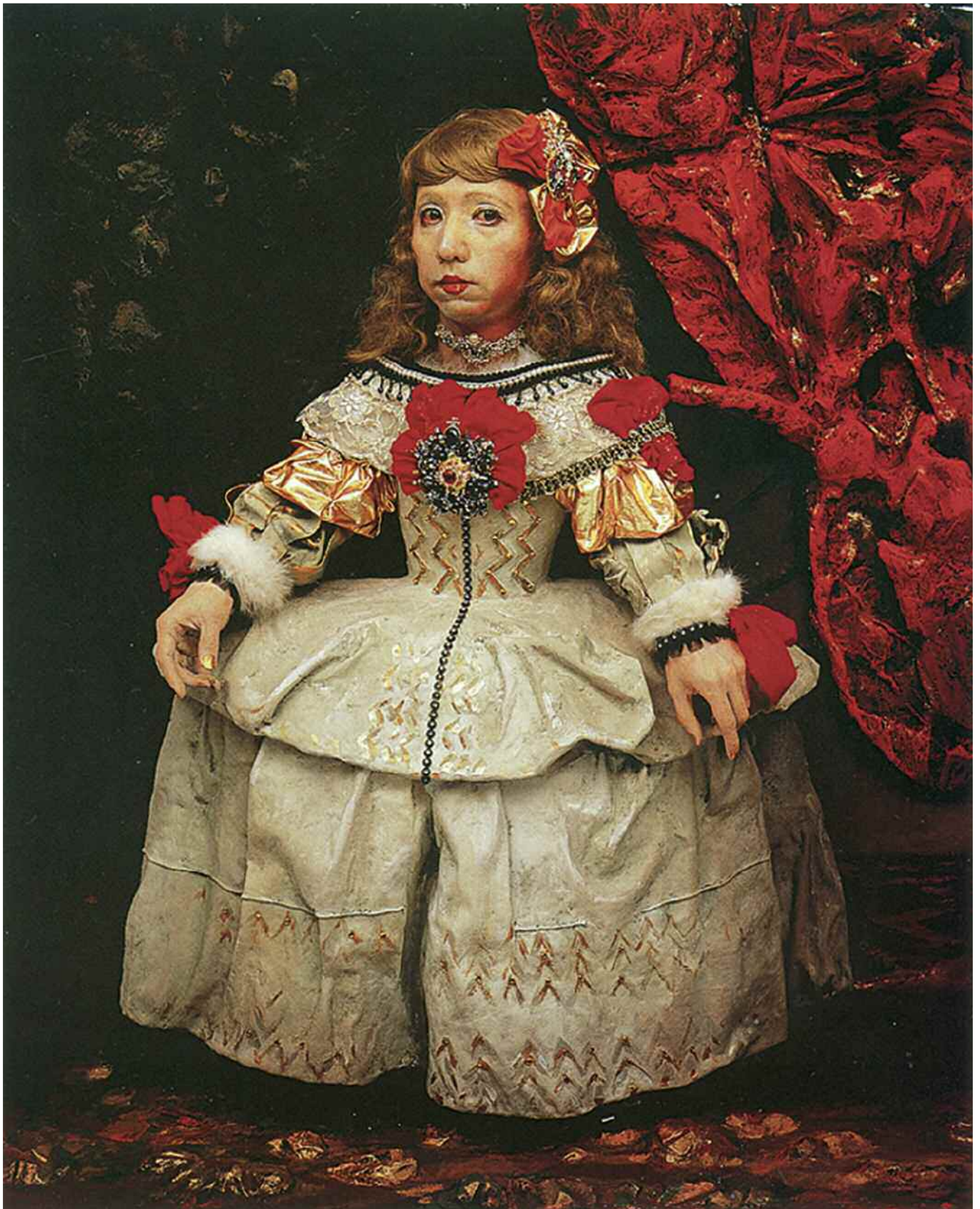
Yasunasa Morimura, Figlia della storia dell'arte (Principessa A9) , 1990. Fotografia laminata a colori, 210x160 cm.