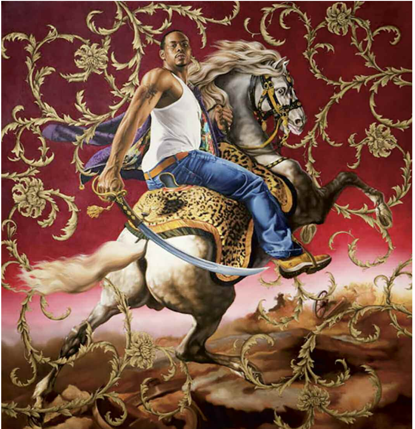
Kehinde Wiley, The officer of the Hussars, 2007. Olio su tela.