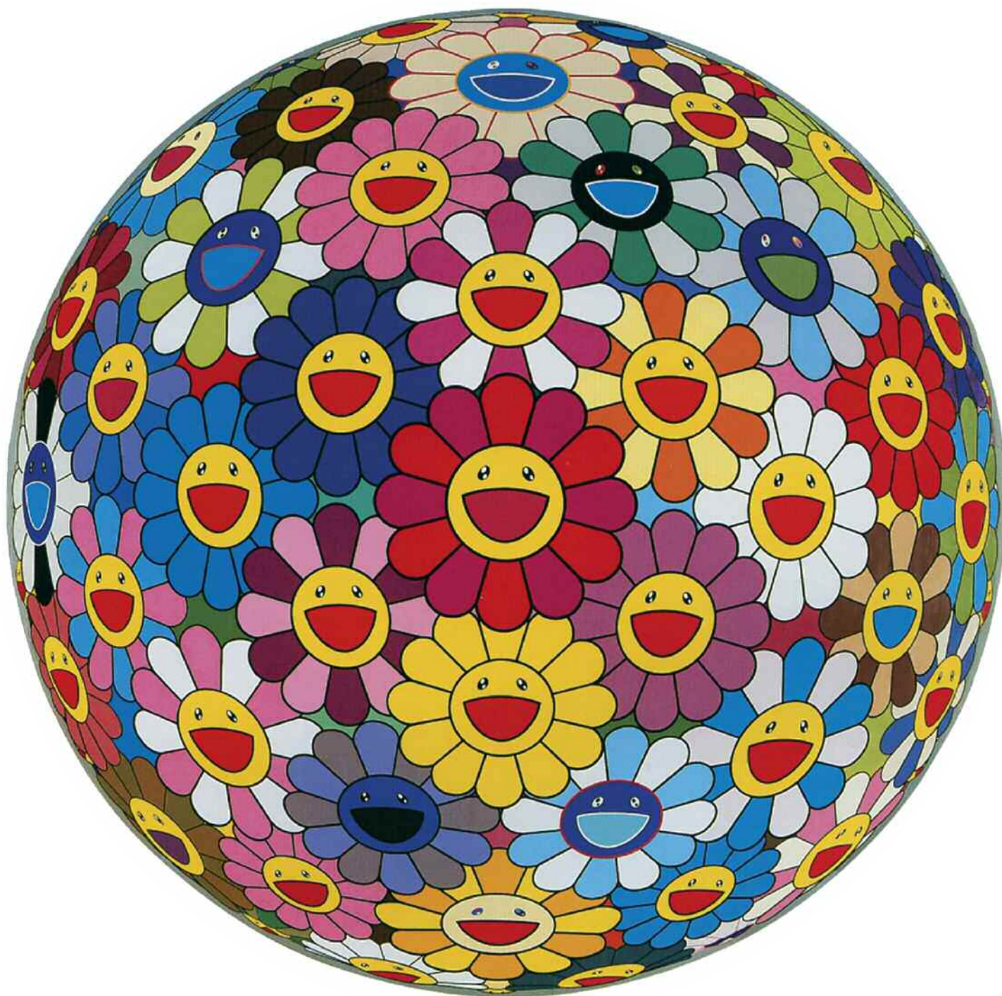
Takashi Murakami, Flower ball (3-D), 2002. Acrilico su tela, diametro 250 cm. Collezione privata.