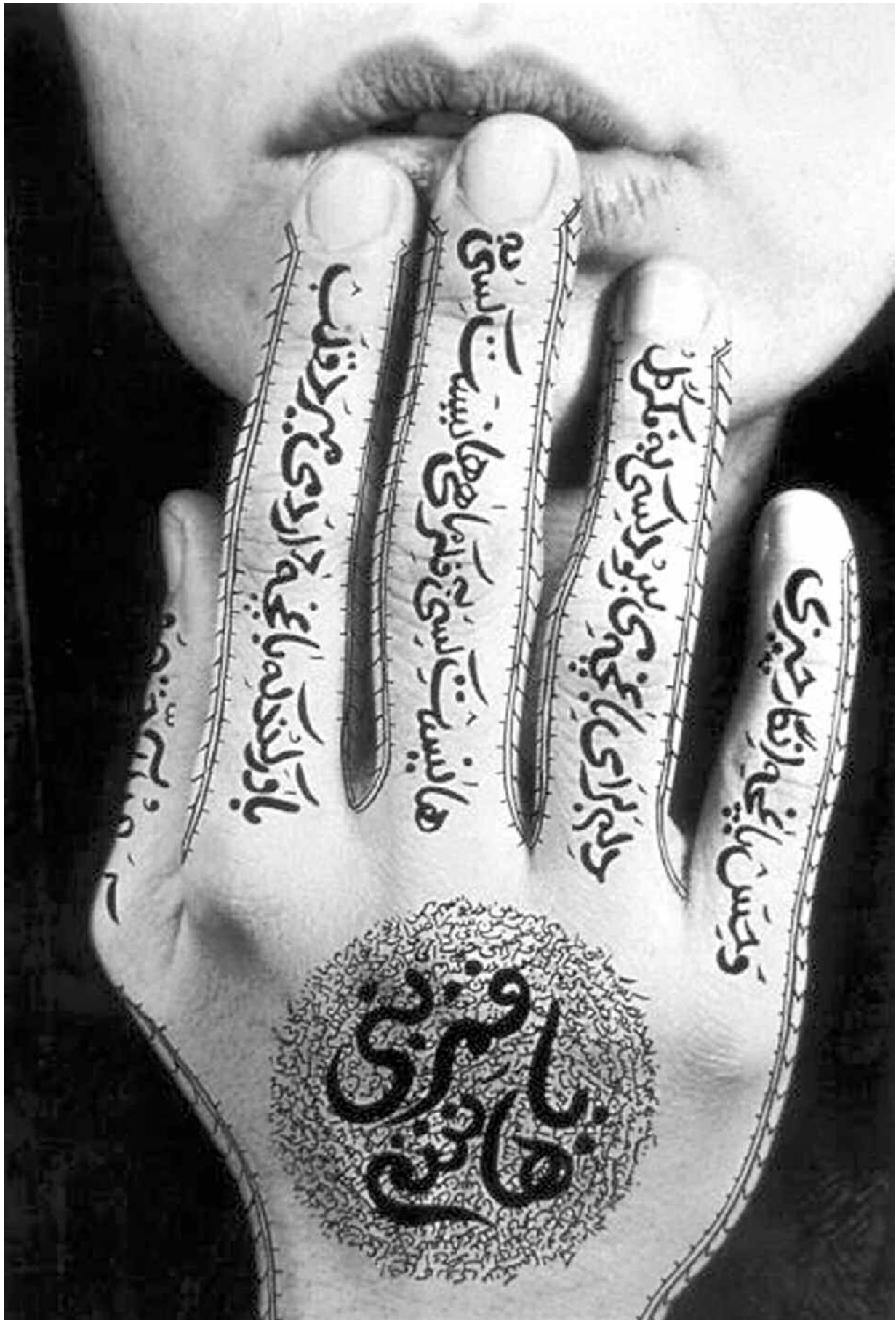
Shirin Neshat, Senza titolo, 1996. Fotografia e inchiostro.