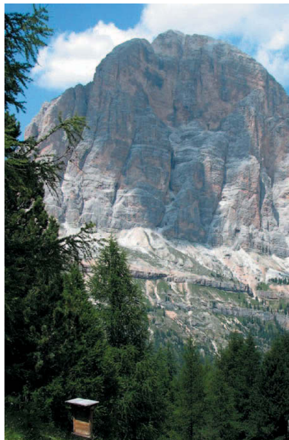
Fig. 4. a. Vista aerea di un atollo corallino del Pacifico. b. Le Dolomiti sono formate da rocce che derivano da antichi fondali marini costituiti da depositi di gusci e scheletri di organismi marini.