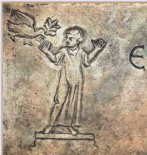
Tomba di Irene, III-IV secolo. Catacombe di San Callisto, Roma.