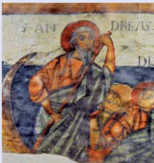
Sant' Andrea tra gli Apostoli, affresco della Collegiata di Sant' Orso, ad Aosta. XI secolo.