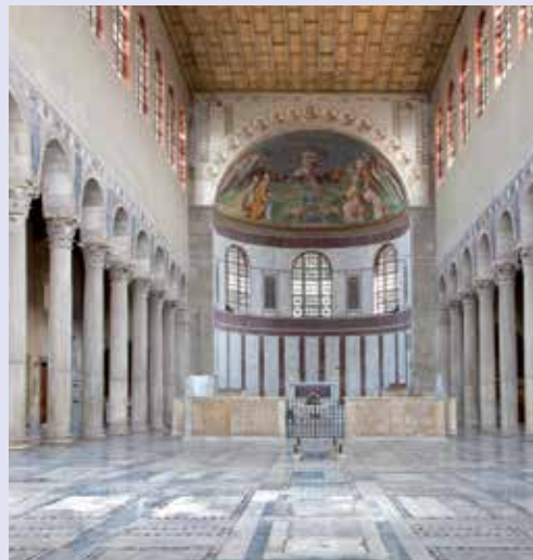
Basilica di Santa Sabina a Roma, 420-432.

Le prime testimonianze di arte cristiana si trovano nelle catacombe , i cimiteri sotterranei scavati fuori delle città e disposti su più livelli.