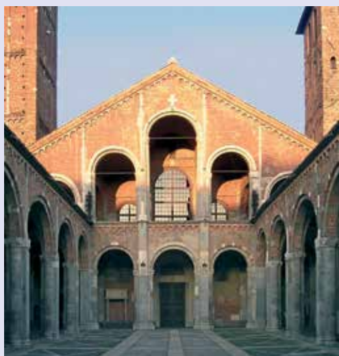
Basilica di Sant' Ambrogio a Milano, fine XI sec.