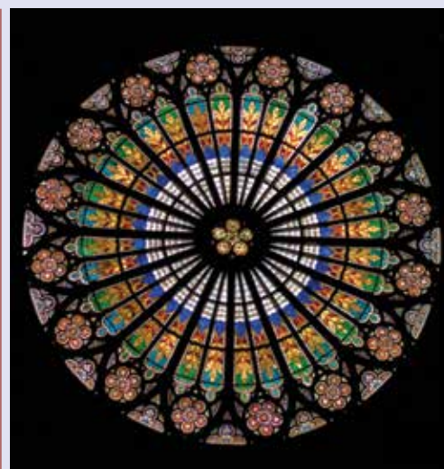
La vetrata del rosone della Cattedrale di Strasburgo, in Francia.