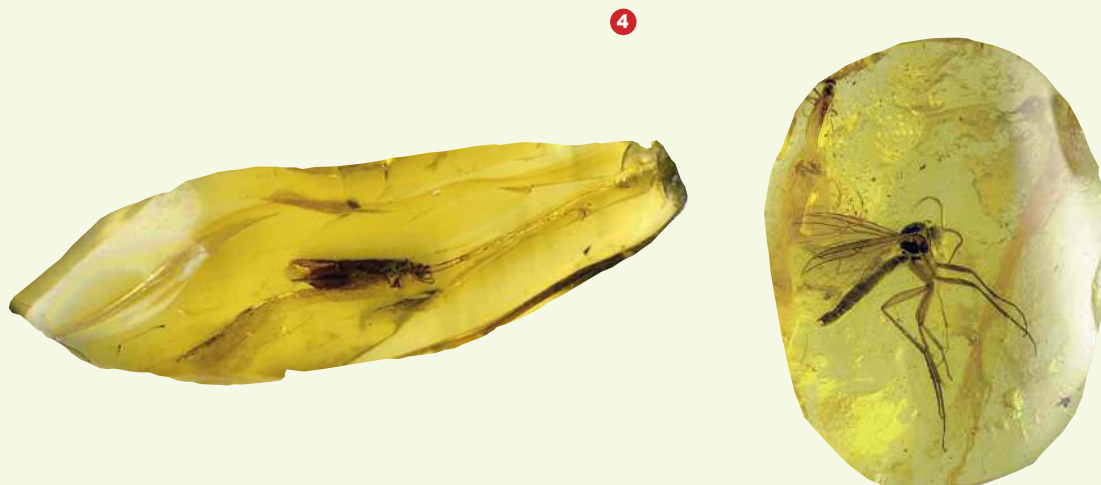
Fig. 4. Due insetti rimasti intrappolati nell'ambra.

Un altro tipo ben noto di fossilizzazione "a secco" è l'inglobamento di insetti e di altri piccoli animali nella resina degli alberi. Nel tempo la resina fossilizza diventando dura e compatta ( ambra ) conservando intatti gli animaletti che contiene (fig. 4). Si tratta di animali di piccole dimensioni, ma anche il loro studio ( micropaleontologia ) fornisce informazioni importanti sull'evoluzione dei viventi e sulla storia geografica e geologica di ogni regione del nostro pianeta.