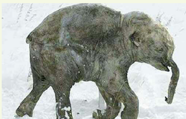
Fig. 3. Il corpo mummificato di un piccolo mammut, rimasto per 37 000 anni nel terreno congelato (permafrost) della tundra artica.

3