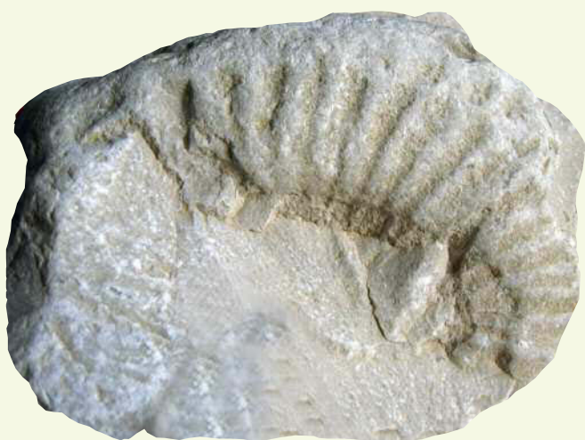
Fig. 5. Ammonite nella roccia.

Particolarmente indicative a questo riguardo sono le ammoniti , animali le cui specie sono vissute in media per 1-3 milioni di anni. Una volta accertata l'antichità delle varie specie in una sequenza che va dalle più antiche (400 milioni di anni fa) alle più recenti (65 milioni di anni fa), è possibile datare qualsiasi roccia contenente ammoniti identificandone i fossili presenti nella roccia stessa. Le ammoniti (come molti altri fossili ben studiati) vengono perciò chiamati fossili guida e sono molto utili per lo studio della geologia di una regione ( fig. 5 ).