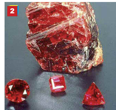
Fig. 2. Cristallo di rubino grezzo e in primo piano gemme variamente tagliate.

Il rubino è di colore rosso ( ruber , in latino) dovuto alla presenza nei suoi cristalli di tracce di ossido di cromo (fig. 2). Le miniere più famose di rubino si trovano nel Myanmar (Birmania). Oggi, per migliorare il colore dei rubini di bassa qualità, si usano trattamenti particolari che prevedono il riscaldamento della pietra fino a 1800 °C. Rubini artificiali furono prodotti già nella prima metà dell'Ottocento fon-