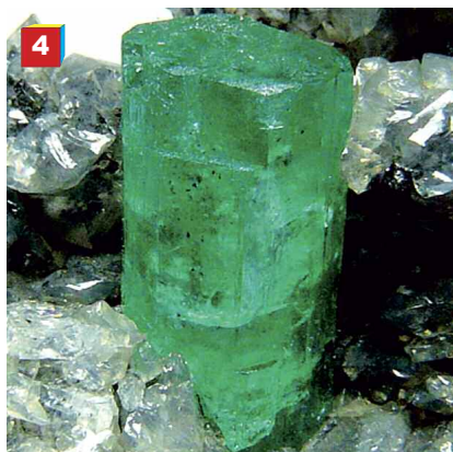
Fig. 4. Cristallo di smeraldo su calcite.

Lo smeraldo è trasparente e di colore verde per la presenza di cromo e/o di vanadio (fig. 4). I suoi giacimenti si tro-