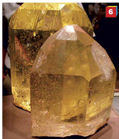
Fig. 6. Cristallo di topazio.

arancio, rosso o verde. Giacimenti di topazio si trovano un po' in tutto il mondo, ma soprattutto in Brasile.