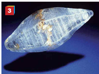
Fig. 3. Cristallo di zaffiro.

dendo ad alta temperatura allume di potassio con aggiunta di cromo.