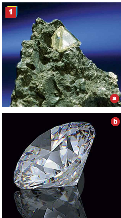
Fig. 1. a. Cristallo di diamante su kimberlite. b. Diamante tagliato a brillante

■ DIAMANTE. È composto da carbonio puro ed è la più famosa tra le pietre preziose (fig. 1a). I diamanti si trovano in rocce note come kimberliti , nome che deriva da Kimberly, località della Repubblica sudafricana dove fu scoperto il primo grande giacimento primario (in cui i diamanti si rinvennero nella stessa roccia originaria): le kimberliti, formatesi a grandi profondità (circa 150 km), sono presenti in camini vulcanici detti appunto camini diamantiferi o anche condotti kimberlitici che