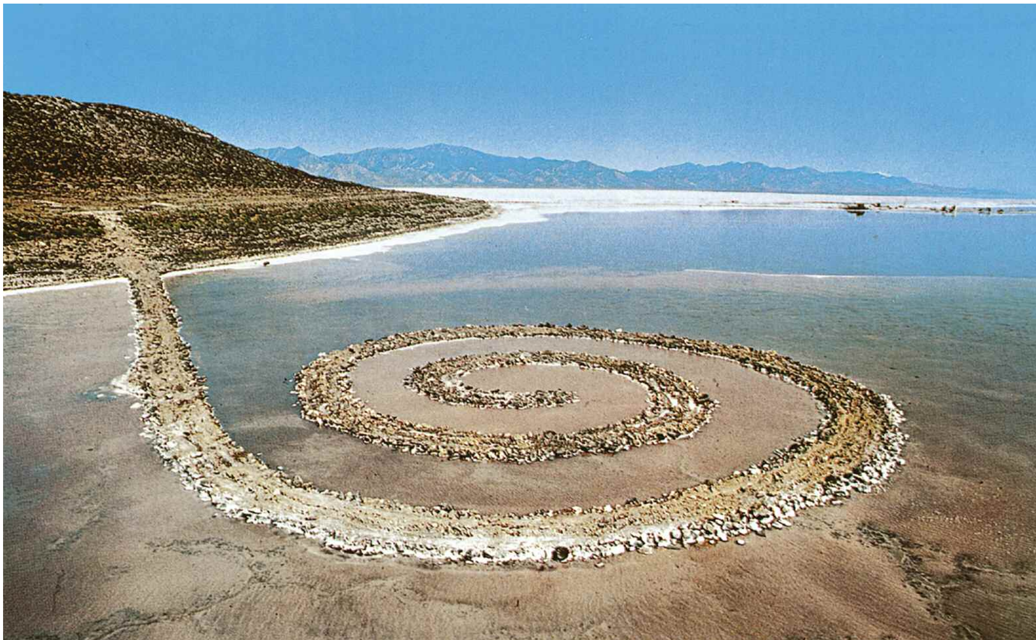
Robert Smithson, Spiral Jetty, 'Molo a spirale', 1970. Grande Lago Salato (Utah), USA.