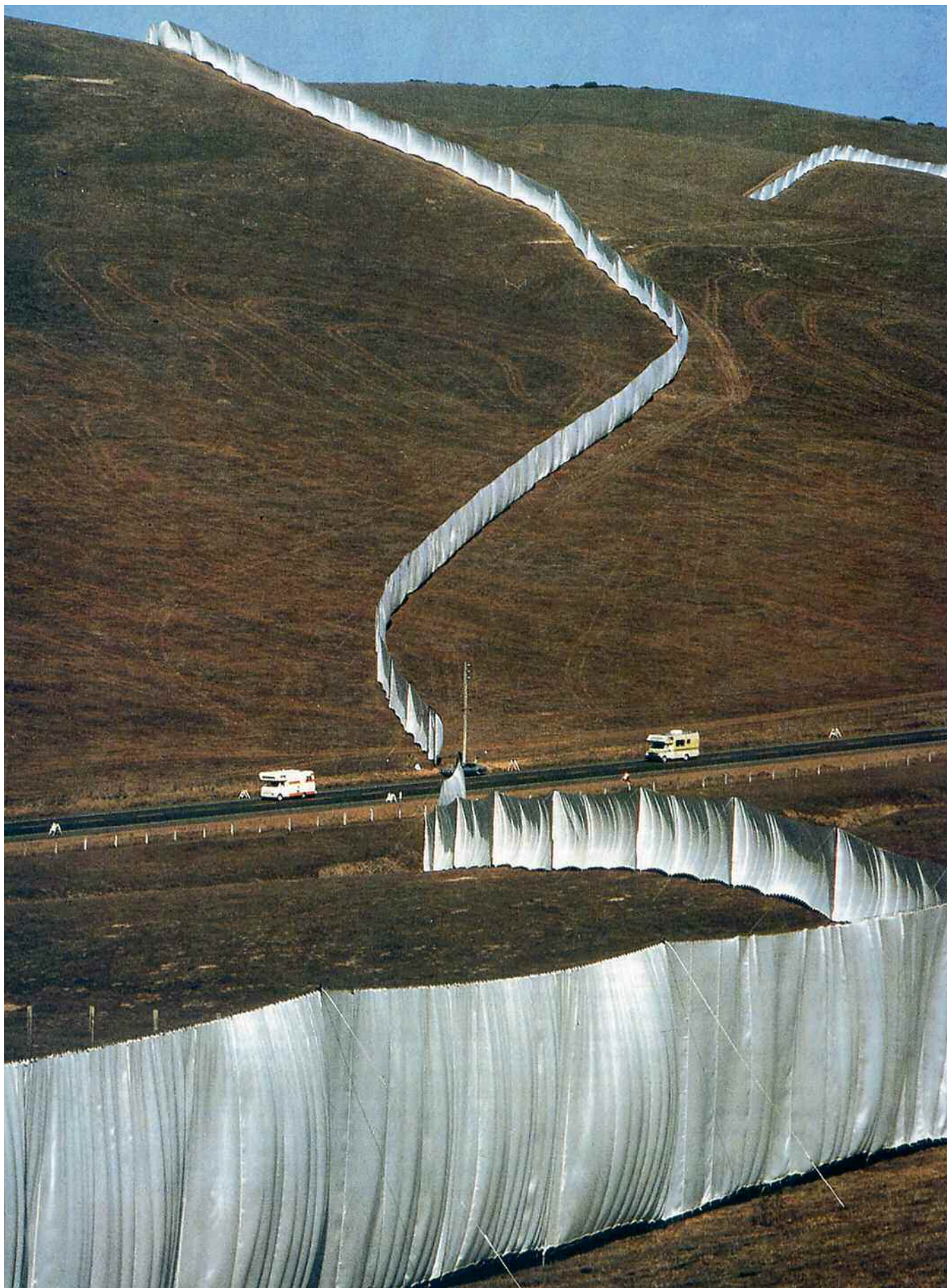
Christo, Running Fence ('Barriera continua'), 1976. 2000 teli di nylon e supporti metallici. Lunghezza 40 km. Marin and Sonoma Counties, California.