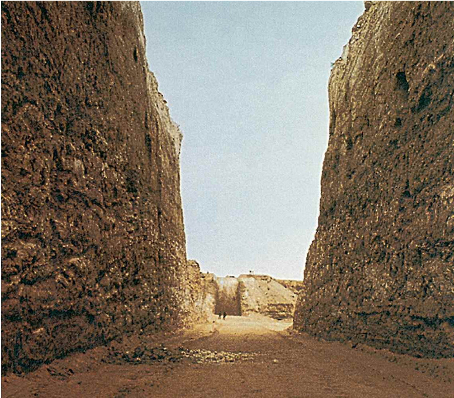
Michael Heizer, Double Negative, 1969-1970. Installazione ambientale nel deserto del Nevada (USA), lato Est.