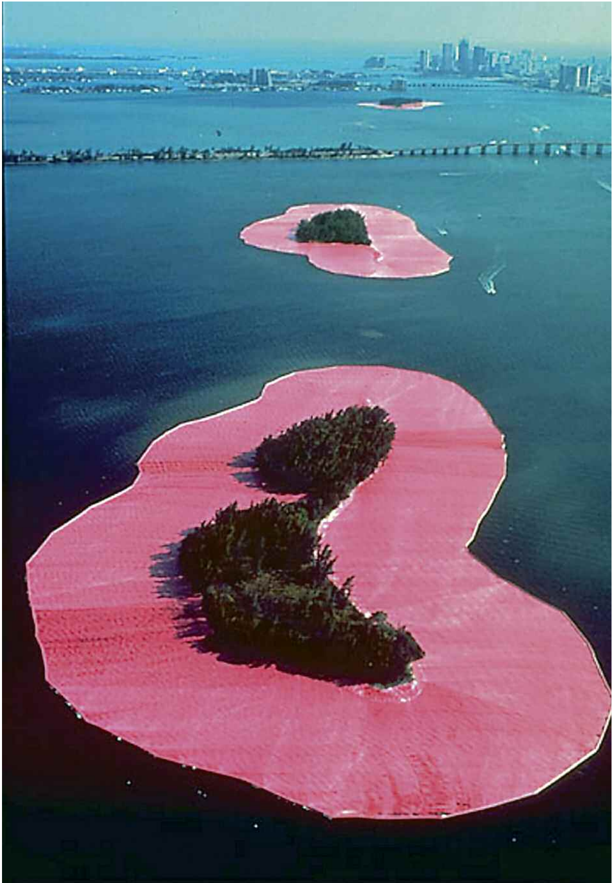
Christo e Jeanne-Claude, Surrounded islands ('Isole circondate'), 1983. Tessuto intorno a 11 isole, 603850 m quadrati. Miami, baia di Biscayne.