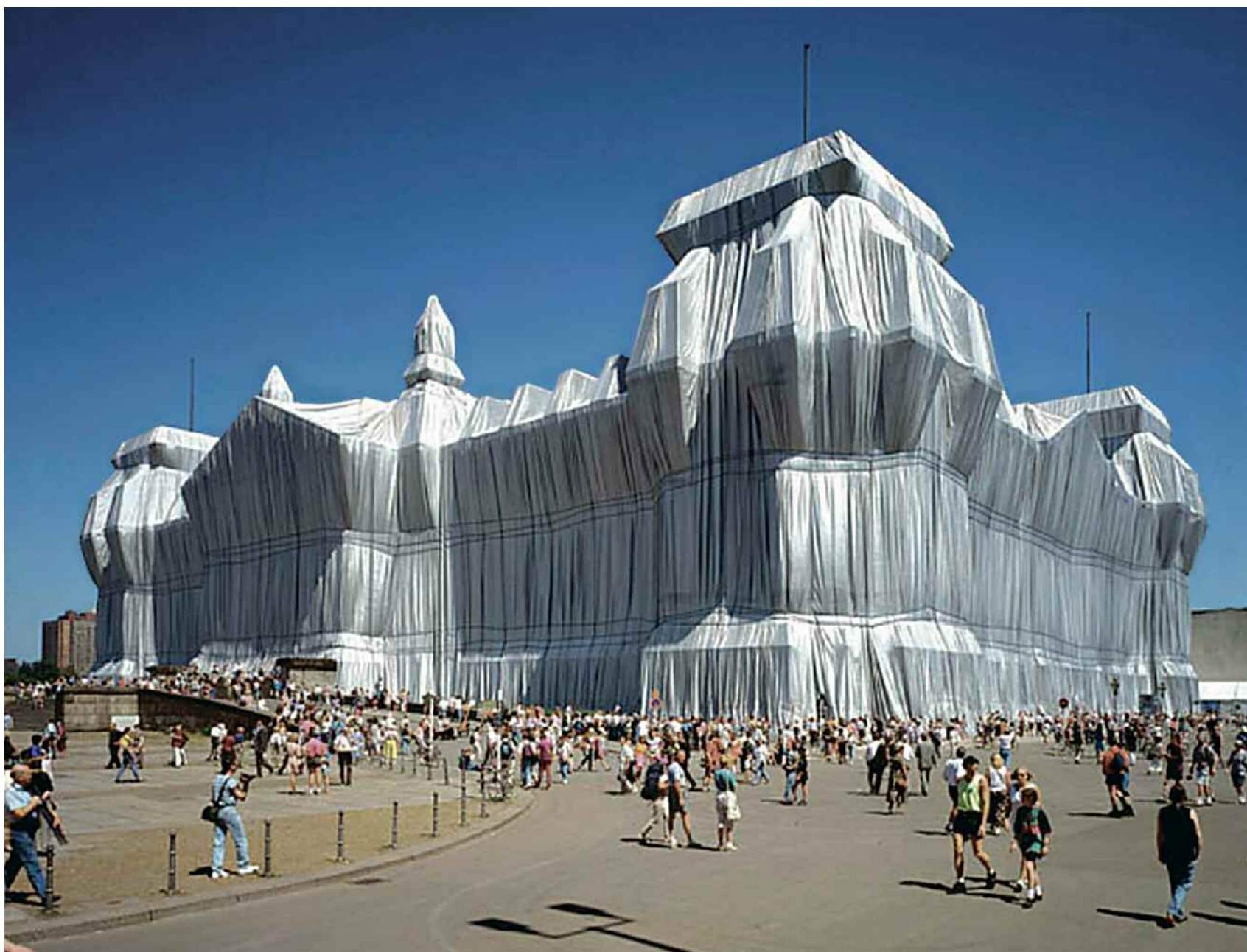
Christo e Jeanne-Claude, Reichstag Impacchettato, 1971-1995. Berlino, Germania.