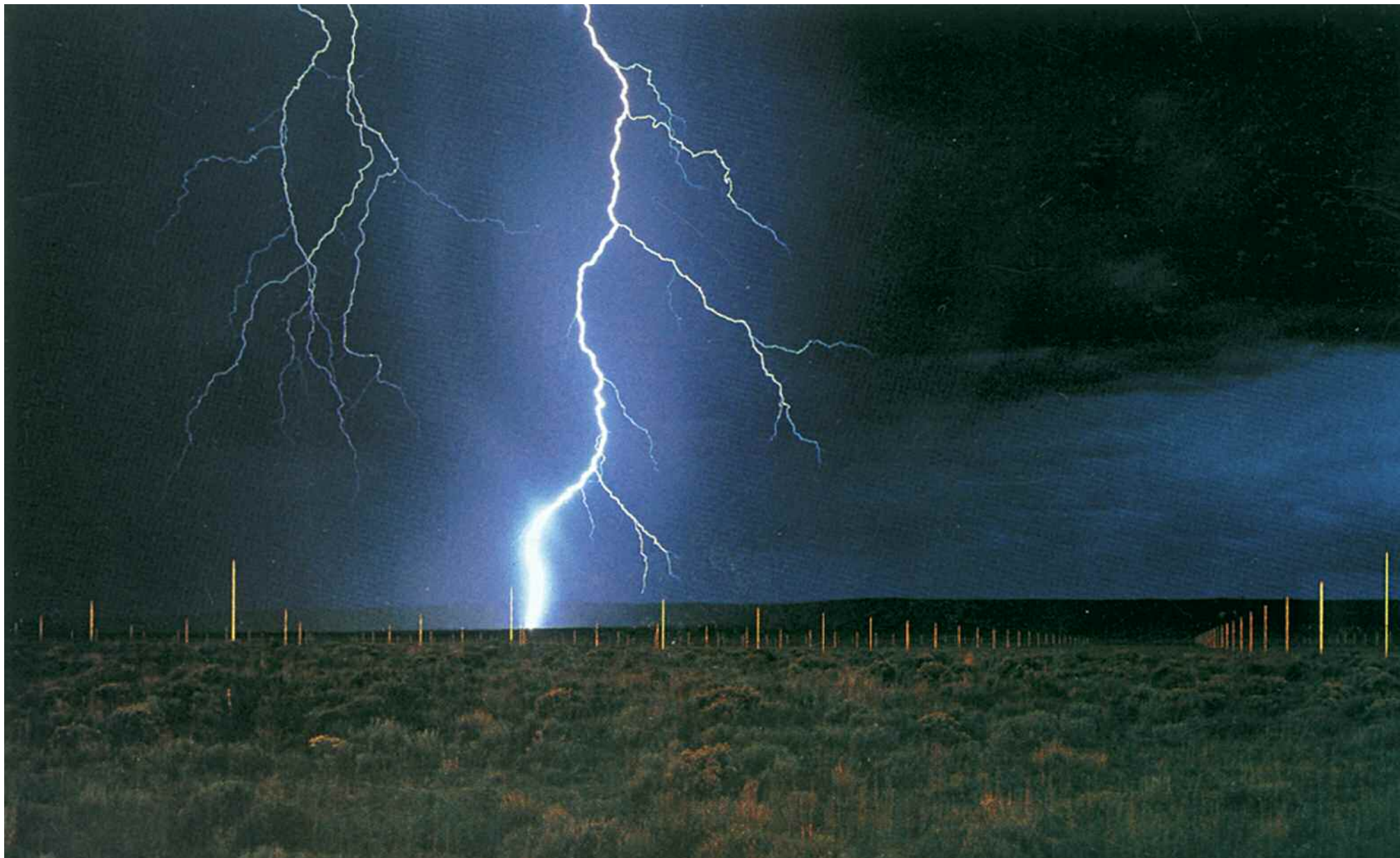
Walter de Maria, The Lightning Field , 1977. Albuquerque, Nuovo Messico. Dia Art Foundation, foto John Cliett.