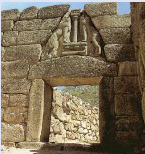
Porta dei Leoni a Micene, XIV secolo a.C.

Non a caso le pitture murali e le decorazioni realizzate sulle ceramiche rappresentano il mondo marino, riti religiosi e giochi collettivi, con colori luminosi e composizioni vivaci.