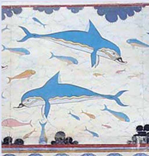
Delfini, affresco dal Palazzo di Cnosso, nell'isola di Creta, 1550-1450 a.C.