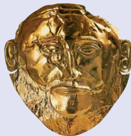
Maschera funeraria detta di Agamennone, dal Tesoro di Atreo, XVI sec. a.C. Micene.

Gli Achei hanno introdotto soluzioni costruttive volte a sostenere enormi pesi, come la falsa cupola .