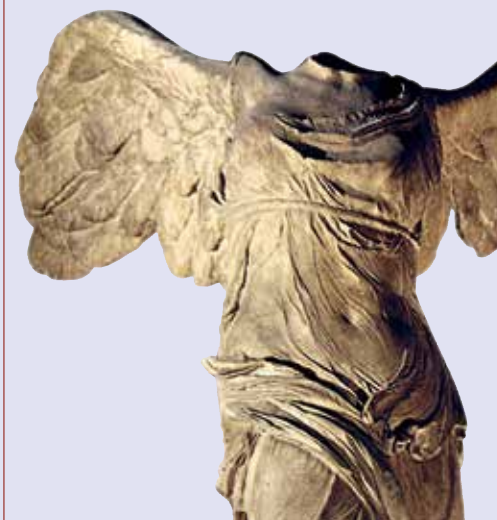
Nike di Samotracia , II secolo a.C. Parigi, Museo del Louvre.