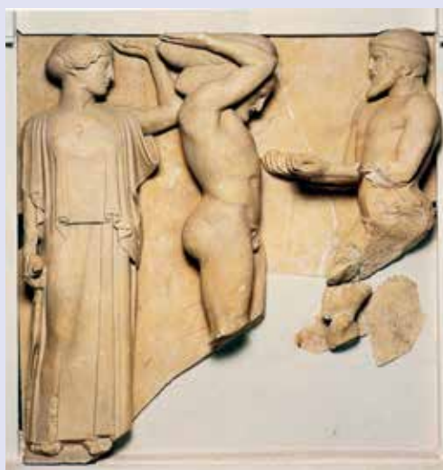
Atene, Eracle e Atlante , metopa del Tempio di Zeus a Olimpia, V sec. a.C. Olimpia, Museo Archeologico.