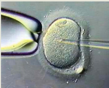
Fig. 3. Iniezione intracitoplasmatica dello spermatozoo nell'ovocita (Icsi).