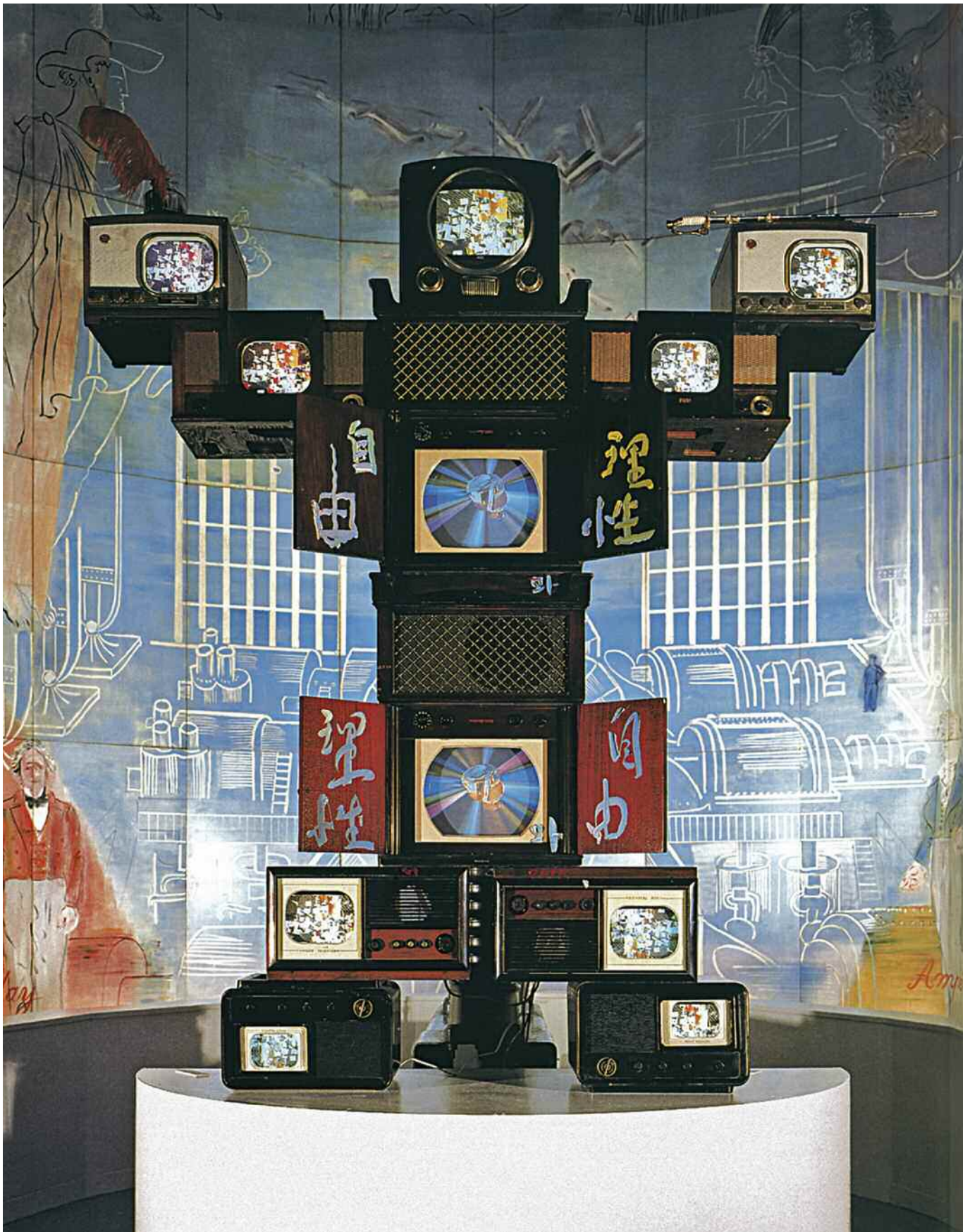
Nam June Paik, Voltaire, 1989. Video scultura, 300x200x55 cm. Parigi, Centre Pompidou.