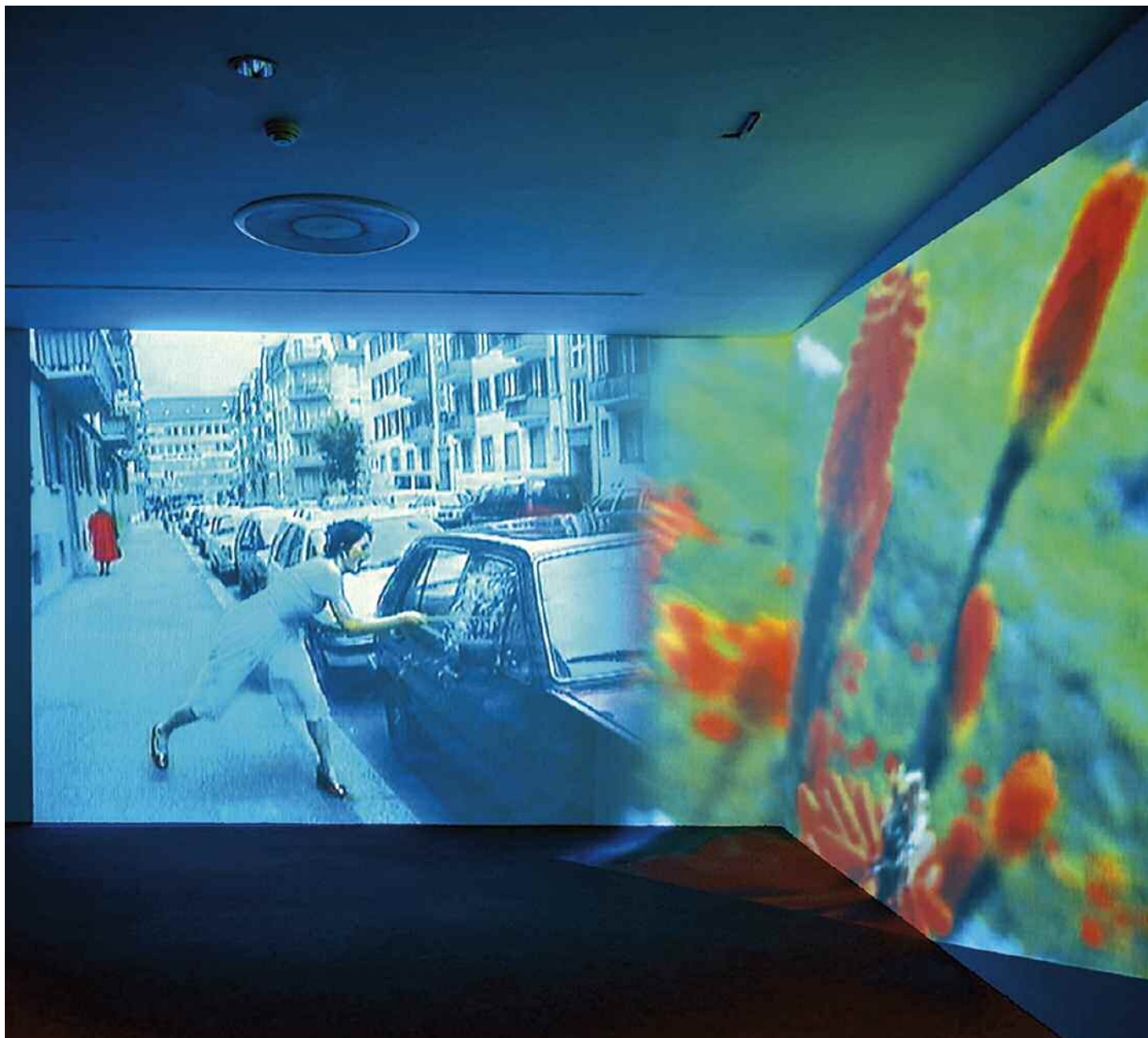
Pipilotti Rist, Ever Is Over All, 1997. Video installazione, due proiezioni sovrapposte, dimensioni variabili. New York, The Museum of Modern Art.