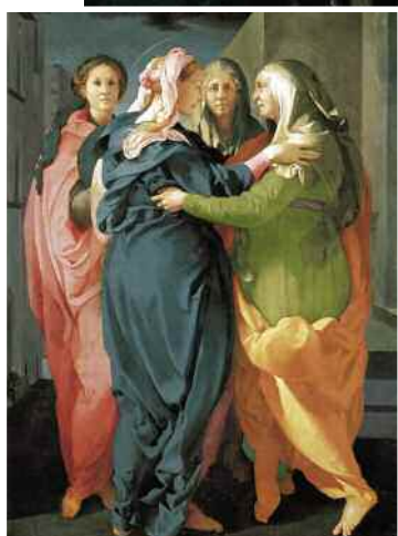
Pontormo, Visitazione, 1528-1529 circa.