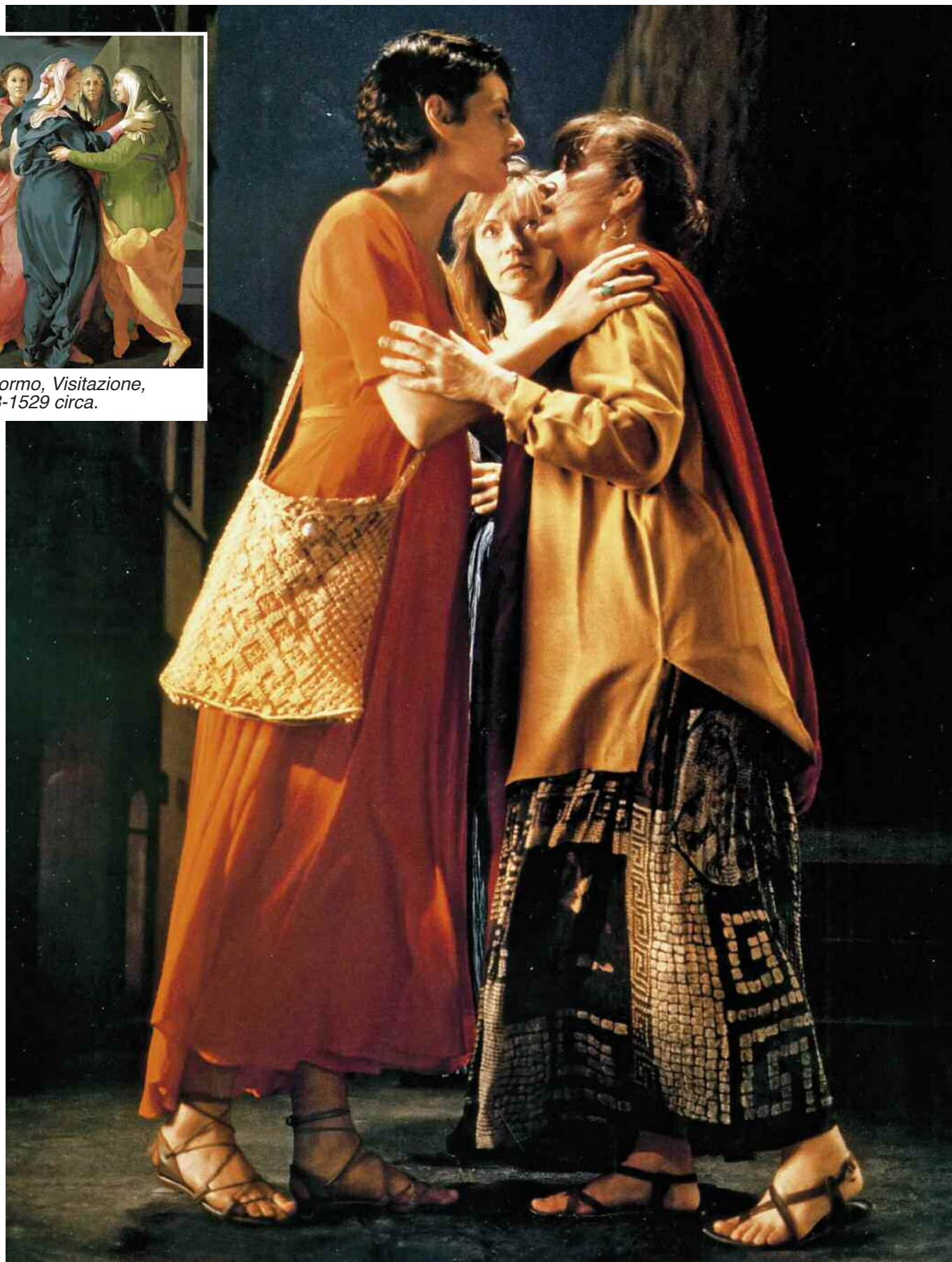
Bill Viola, The Greeting (Il saluto), 1995. Still da videoinstallazione alla Biennale di Venezia.