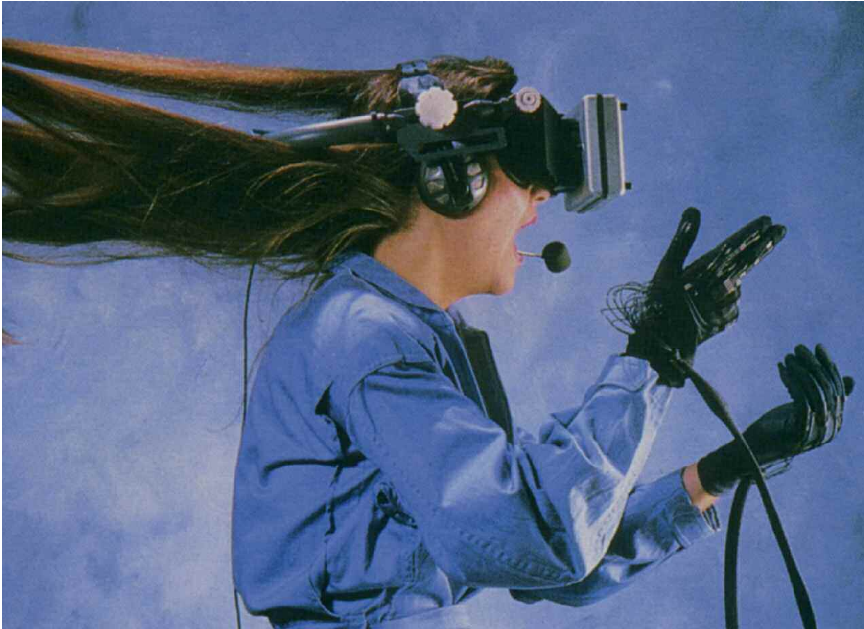
Occhiali della Nasa e guanto Vpl per immersersi nella realtà virtuale.