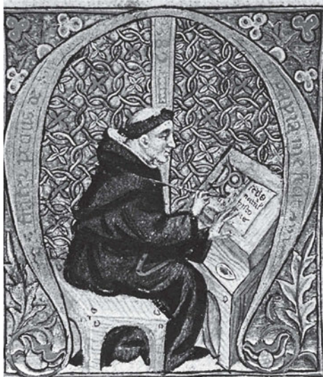
Un monaco amanuense trascrive un testo. Il codice veniva poi decorato da miniaturisti e andava a incrementare il ricco patrimonio delle biblioteche monastiche, grazie alle quali si sono conservate molte opere dell'antichità.

l'insegnamento rimane affidato agli ecclesiastici. Riprende vigore l'attività degli scriptoria di grandi monasteri come Montecassino, Bobbio, Chartres, San Gallo, Fulda; si diffonde inoltre la grafia detta minuscola carolina, le cui lettere erano staccate le une dalle altre, rotondeggianti e facilmente leggibili.