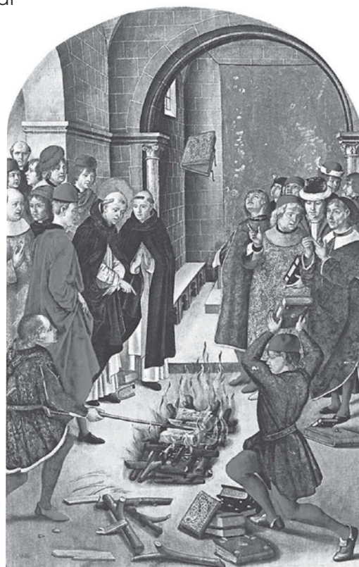
San Domenico assiste a un rogo di libri durante la lotta contro l'eresia catara. Tavola del XV secolo; Madrid, Museo del Prado. In diversi momenti della storia i libri sono stati considerati veicolo di dottrine false e pericolose e, di conseguenza, la loro circolazione è stata limitata e controllata. Durante la Controriforma, Giovanni Della Casa, noto come autore del Galateo, stilò il primo Indice dei libri proibiti per la Chiesa cattolica.

Secondo la studiosa statunitense Elizabeth Eisenstein la rivoluzione inavvertita della stampa influisce in maniera determinante sui mutamenti di pensiero avvenuti nel Cinquecento: non solo Lutero, ma anche la teoria eliocentrica di Niccolò Copernico (1473-1543) e il modello anatomico del corpo umano di Andrea Vesalio (1514-1564) trovano nella stampa un importante strumento di circolazione, oltre alle condizioni necessarie per il loro sorgere. Essa infatti agevola e incoraggia il recupero dei testi antichi, rendendo possibili collezioni più ampie di informazioni e, attraverso i confronti, il rilievo di contraddizioni e limiti; assicura inoltre stabilità e diffusione alle teorie, sollevando lo studioso dalle lungaggi-