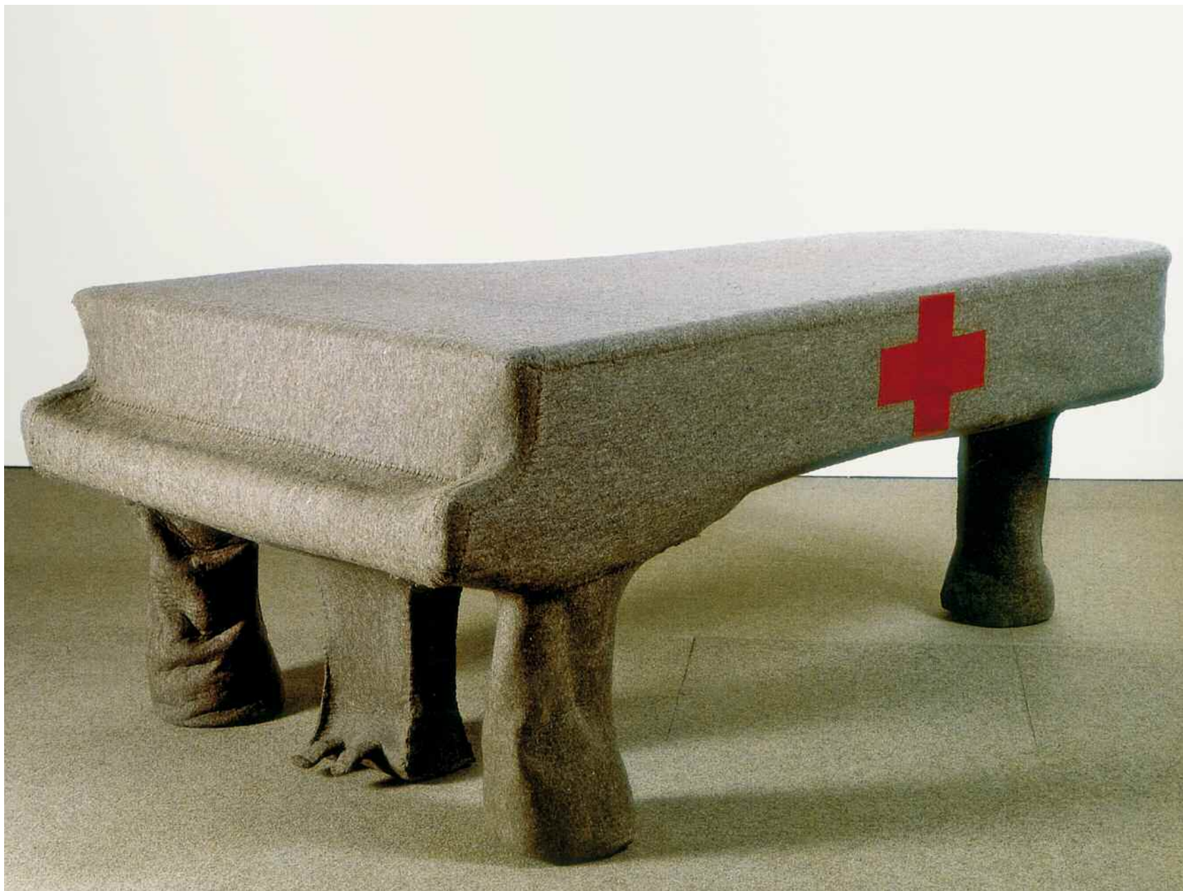
Joseph Beuys, Infiltrazione omogenea per pianoforte a coda, 1968. Pianoforte ricoperto di feltro. Parigi, Centre Pompidou.