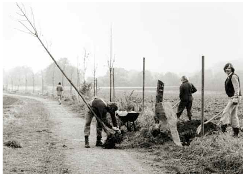
Joseph Beuys, 7000 Eichen (7000 Querce), dal 1982. Querce, steli di basalto, misura delle steli 120 cm circa. Kassel e altre città tedesche.