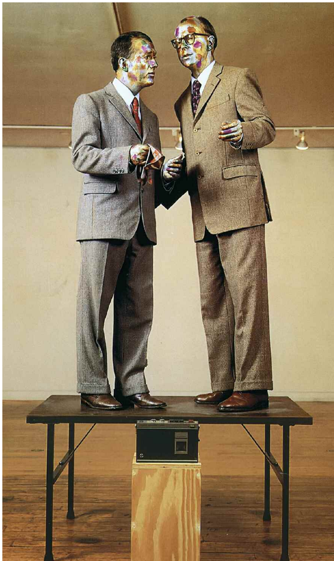
Gilbert & George, Underneath the Arches (‘Sotto gli archi’), 1969. Performance.