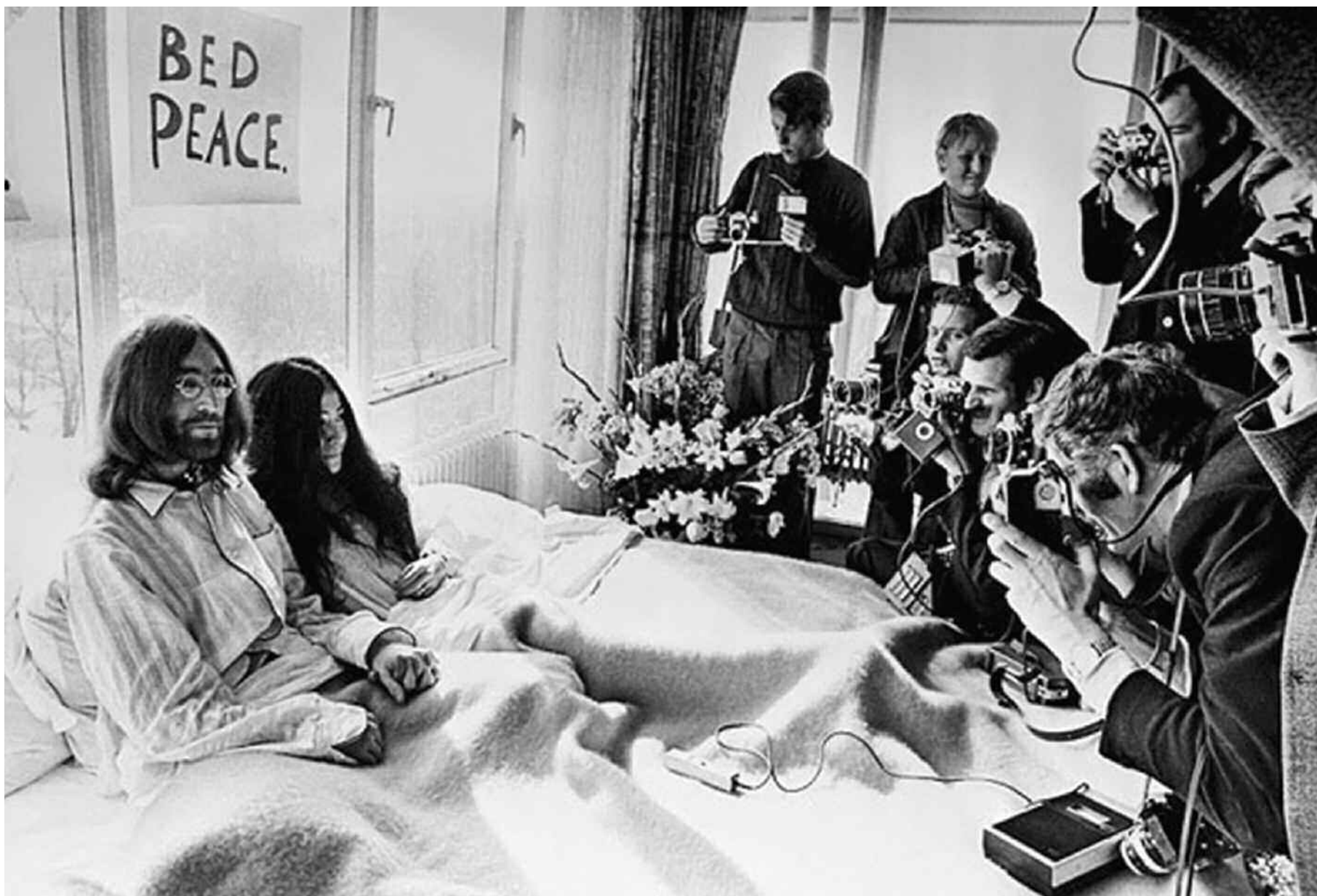
Yoko Ono e John Lennon, un'immagine dell'happening A letto per la Pace, 1969. Amsterdam, Hotel Hilton.