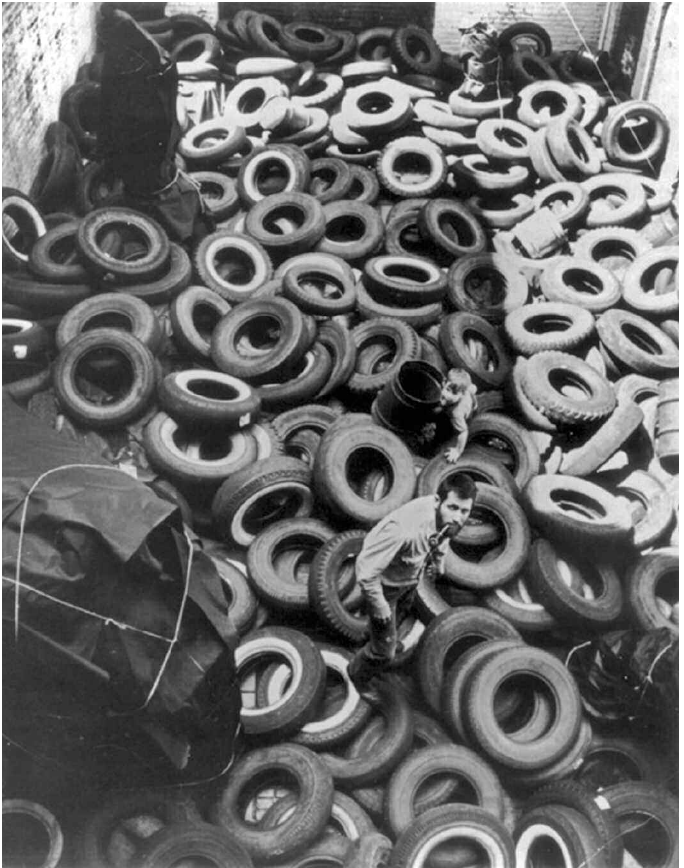
Allan Kaprow, Yard, 1961. Happening. New York, Martha Jackson Gallery.