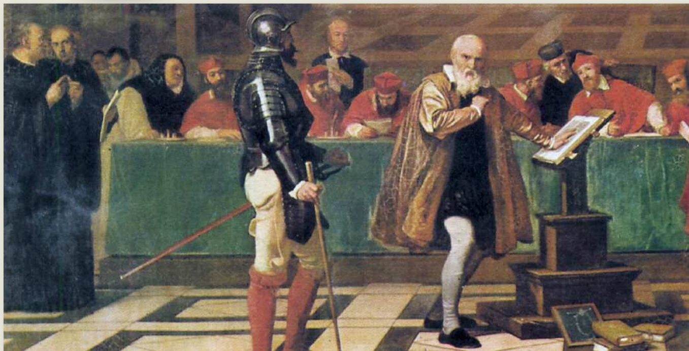
Fig. a. Galileo Galilei di fronte al tribunale dell'Inquisizione in un dipinto di Robert Fleury, Museo del Louvre.

Riportiamo qui di seguito un brano del Dialogo sopra i due massimi sistemi , l'opera con cui Galileo Galilei impose alla tradizione di pensiero aristotelica il nuovo pensiero scientifico.