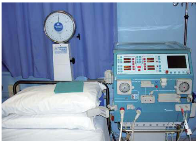
Fig. 1. Il rene artificiale.

Per eseguire l'emodialisi è indispensabile, oltre al rene artificiale, un accesso vascolare adeguato, ossia la creazione, mediante un piccolo intervento chirurgico in anestesia locale, di un collegamento tra un'arteria e una vena del braccio. Questo collegamento permette "l'irrobustimento" della vena in modo tale da consentire il facile inserimento dei due aghi che durante la seduta dialitica vengono collegati al circuito extracorporeo del rene artificiale.