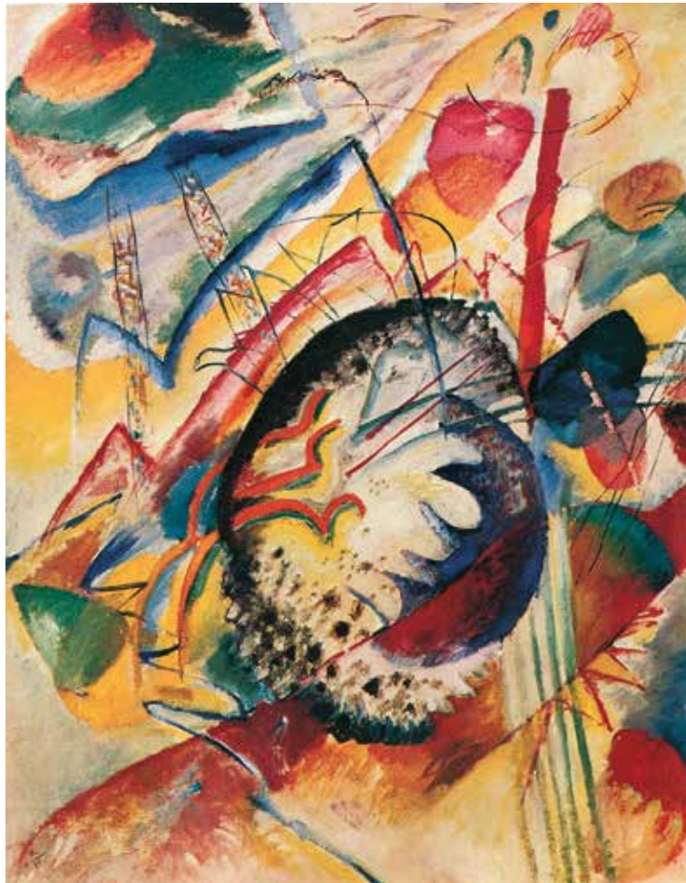
Vasilij Kandinskij, Grande studio , 1914. Olio su tela 100x78. Rotterdam, Museo Boijmans Van Beuningen.

Il Grande studio , realizzato per uno dei pannelli commissionati da Edwin R. Campbell, uno dei fondatori della casa automobilistica americana Chevrolet, appartiene alla fase lirica : dominano i colori vivaci e forti, mentre si scorgono a fatica le figure. Il pittore sembra affidarsi alla forza del gesto: i colori contrastati, appresi dalla pittura dei fauves e da quella di Van Gogh, si ravvivano a vicenda. La composizione è costruita sulla base del grumo di colori al centro, di forma complessiva vagamente circolare.