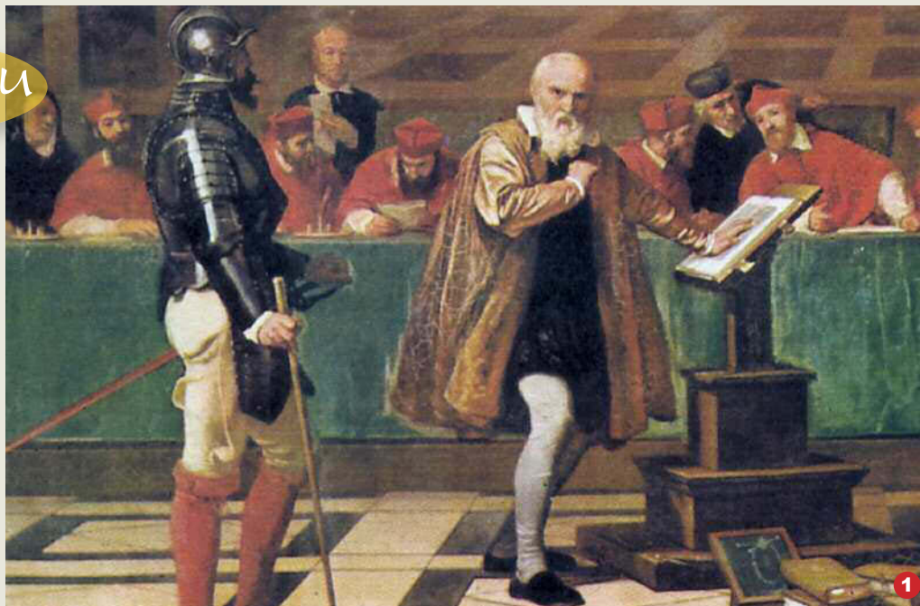
1. Galileo Galilei di fronte al tribunale dell'Inquisizione in un dipinto di Robert Fleury, Museo del Louvre (Parigi).