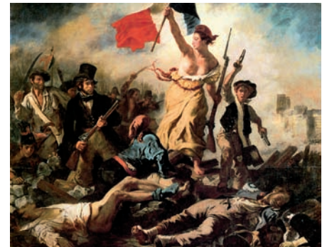
Eugène Delacroix, La Libertà che guida il popolo.