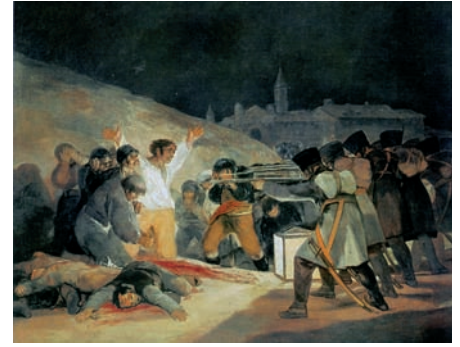
Francisco Goya, Fucilazione del 3 Maggio 1808.