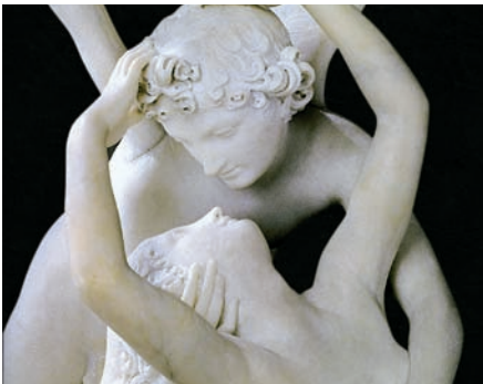
Antonio Canova, Amore e psiche.