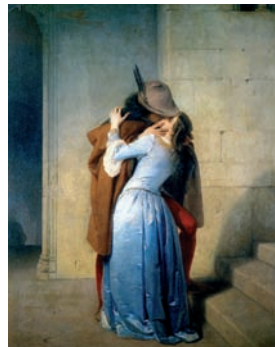
Hayez, Il bacio.