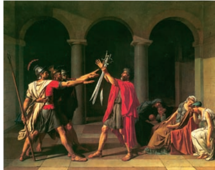
Jacques-Louis David, Il giuramento degli Orazi.