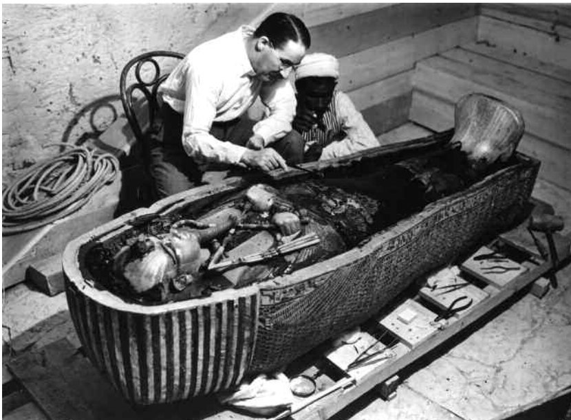
Howard Carter esamina il sarcofago di Tutankhamon.

Il volto appare idealizzato, secondo i canoni voluti dallo stesso Tutankhamon; tuttavia, alcuni dettagli, come le labbra carnose, mostrano una tendenza naturalistica.