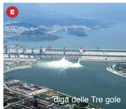
diga delle Tre gole

■ LAGHI DI SBARRAMENTO ARTIFICIALE ( fig. E ). Sono creati dall'uomo sbarrando una valle percorsa da un corso d'acqua con una diga. Il bacino artificiale che così si ottiene, oltre a fungere da bacino di alimentazione dell'acqua per usi civili e agricoli, permette la realizzazione di centrali idroelettriche, sfruttando l'energia di caduta dell'acqua. Tra i più imponenti bacini artificiali ricordiamo quelli creati con la diga delle "Tre gole" sul fiume Yangtze (Cina; fig. E ), con la diga di Itaipu sul fiume Paranà (Brasile-Paraguay) e con la diga di Assuan lungo il Nilo, in Egitto (con la creazione del lago Nasser).