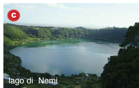
lago di Nemi

■ LAGHI VULCANICI. Occupano crateri o caldere di vulcani spenti, come i laghi di Bolsena, Bracciano, Albano, Vico e Nemi ( fig. C ) nell’Italia centrale.