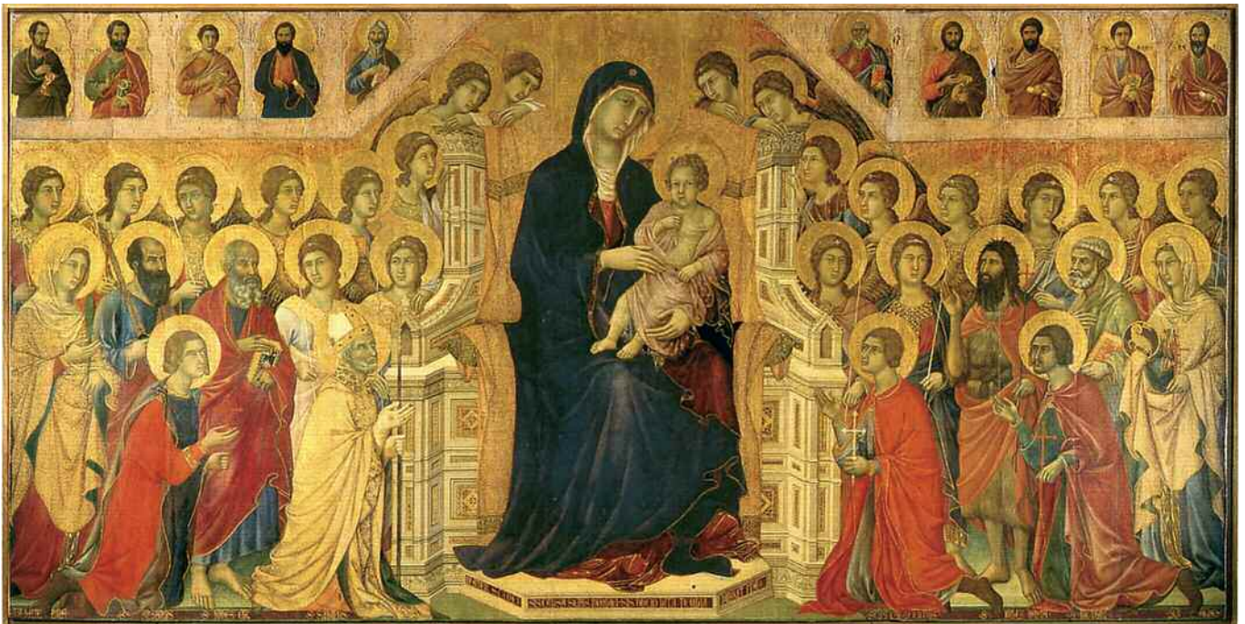
Duccio di Buoninsegna, Maestà , 1308-1311. Tempera e oro su tavola, 370x450 cm. Siena, Museo dell'opera del Duomo.

Rimossa all'inizio del Cinquecento dall'altare maggiore, la grande tavola venne smembrata nel 1711 e alcune parti sono in vari musei del mondo.