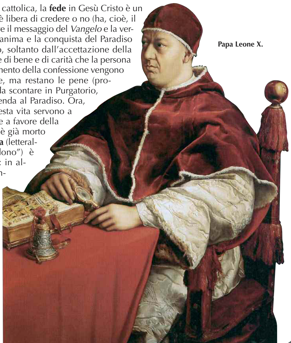
Papa Leone X.

Secondo la teologia e la tradizione cattolica, la fede in Gesù Cristo è un atto di scelta di ogni persona, che è libera di credere o no (ha, cioè, il libero arbitrio di accettare o rifiutare il messaggio del Vangelo e la verità della Chiesa). La salvezza dell'anima e la conquista del Paradiso dopo la morte non derivano, però, soltanto dall'accettazione della fede in Gesù, ma anche dalle opere di bene e di carità che la persona compie nella sua vita. Con il sacramento della confessione vengono perdonati i peccati, cioè le colpe, ma restano le pene (proporzionali alle colpe commesse) da scontare in Purgatorio, prima che l'anima, purificata, ascenda al Paradiso. Ora, le opere di bene e di carità in questa vita servono a diminuire e a scontare queste pene a favore della nostra anima o delle anime di chi è già morto e si trova in Purgatorio. L' indulgenza (letteralmente la parola significa "perdono") è appunto questo "sconto di pena"; in alcuni casi particolari e a certe condizioni di condotta spirituale, l'indulgenza può essere plenaria, cioè può scontare tutte le pene in relazione ai peccati confessati. Tra le opere di bene che facevano acquistare indulgenza era compresa l'offerta di denaro alla Chiesa in relazione alla propria ricchezza: dalla semplice elemosina ai lasciti di case e terre, di cui la Chiesa si serviva per mantenere il clero, le istituzioni ecclesiastiche e le opere di assistenza ai poveri e ai malati.