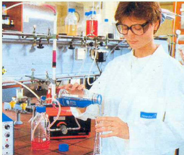
2. Un moderno laboratorio chimico.