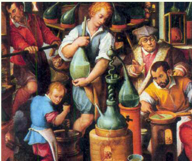
1. Gli alchimisti , dipinto di Giovanni Stradano (1523-1605), Firenze, Palazzo Vecchio.