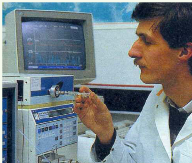
4. Gas cromatografo: si rilevano quantità molto ridotte di sostanze.

In quest'ultimo caso la spiegazione teorica di un fenomeno chimico viene spostato a "livello microscopico", dal greco micros che vuoi dire piccolo . Si considera cioè il comportamento di quelle particelle estremamente piccole dell'ordine di 10^{-9} m, che costituiscono la materia e che non possiamo seguire con i nostri sensi.