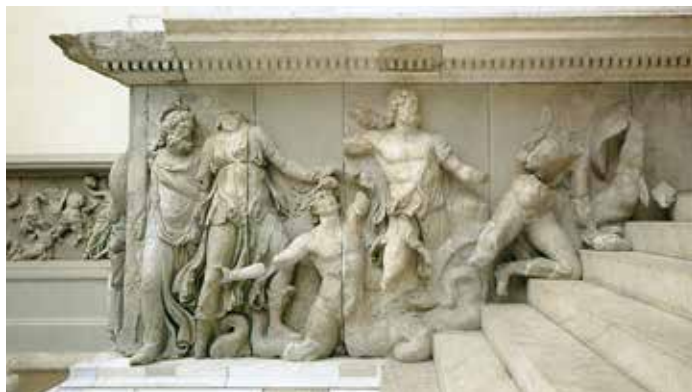
Firòmaco , particolare del fregio sul fianco occidentale della scalinata dell' Altare di Pergamo , raffigurante le divinità marine che hanno combattuto al fianco di Zeus contro i Giganti.

Con i re attàlidi, la città presentò sempre più un impianto articolato e scenografico, arricchito di monumentali edifici pubblici; essa trovava la massima magnificenza nell' Acropoli , la zona sacra posta nella posizione più elevata. Importanti templi furono eretti e dedicati alle divinità classiche, mentre la città e i monumenti si dotarono di splendide statue in bronzo e in marmo.