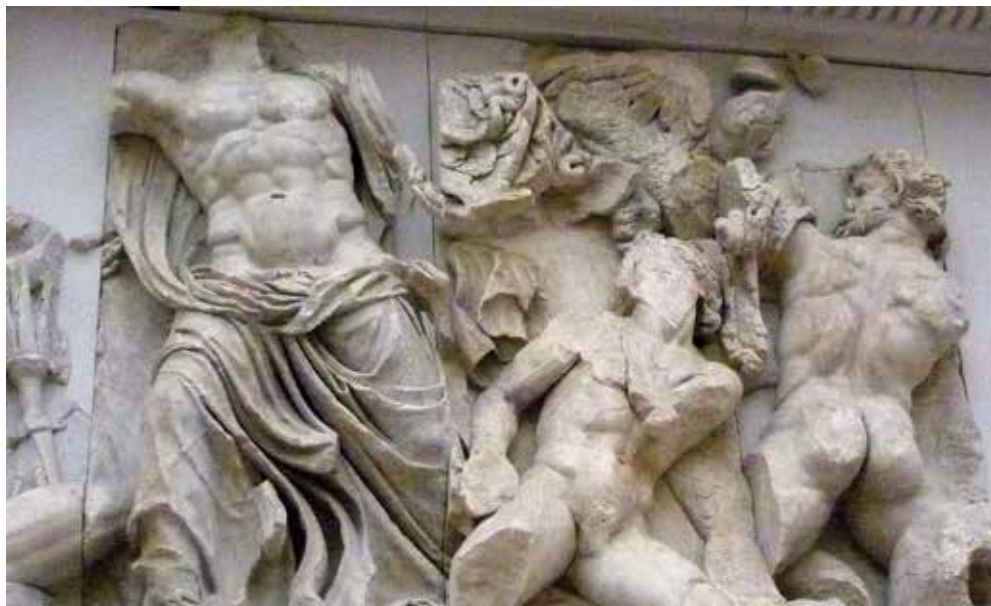
Firòmaco , particolare della Gigantomachia con le figure di Zeus e Porfirione, sul fianco orientale dell' Altare di Pergamo .

La parte edificata sulla piattaforma è circondata da un duplice porticato: uno esterno, che la cinge interamente, e l'altro interno, attorno all'ara sacrificale, formato da colonne ioniche binate, collegate tra loro da un piccolo setto murario. Qui, sulle pareti di fondo era scolpito un fregio alto 1,56 metri con le Storie di Tèlefo , figlio di Eracle ed eroe della storia di Pergamo, nella lotta contro gli invasori greci.