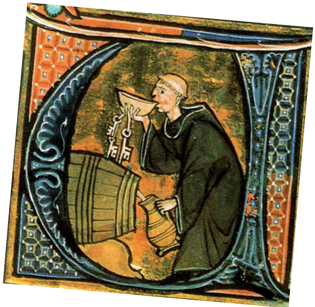
Capolettera miniato con la rappresentazione di un monaco che degusta il vino in una cantina.

da Leo Moulin, La vita quotidiana secondo San Benedetto , Jaca Book