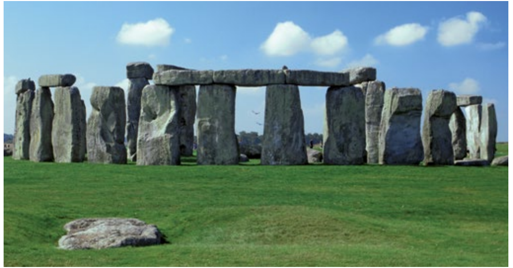
Cromlech di Stonehenge , presso Salisbury in Gran Bretagna, II millennio a.C. Dal 1986 il sito è dichiarato "Patrimonio dell'Umanità" dall'UNESCO.

L' arte della Preistoria segue questo progressivo sviluppo della civiltà umana, esprimendo la cultura, la spiritualità e la creatività simbolica dell'uomo.