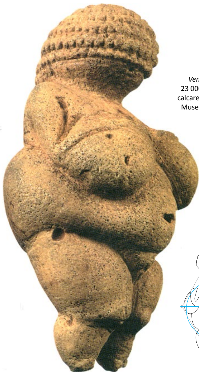
Venere di Willendorf, 23 000-19 000 a.C., pietra calcarea, alt. 11 cm, Vienna, Museo di Storia Naturale.

La presenza di tracce di colore rosso fa pensare ad un rituale magico-religioso.