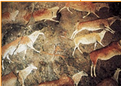
Pitture rupestri, 30 000 - 20 000 a.C.