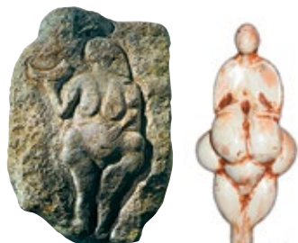
Veneri scolpite e incise, 20 000 a.C.