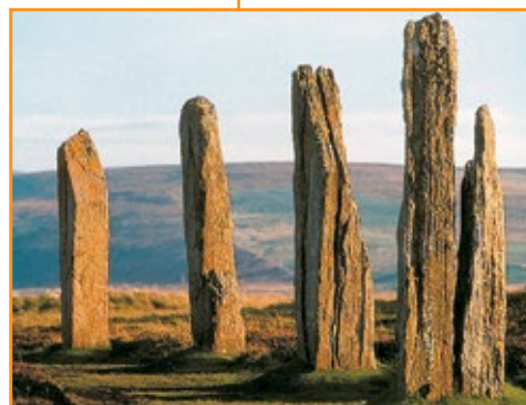
Menhir, 5000 a.C.