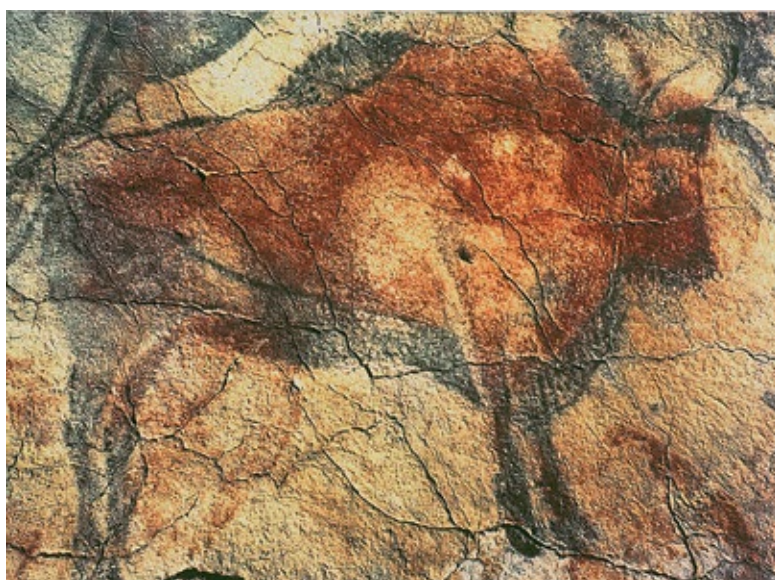
Bisonte , pittura rupestre dalle grotte di Altamira in Spagna. 12 000 circa a.C. L'abate Breuil definì il ciclo di pitture di Altamira come "la Cappella Sistina dell'arte rupestre".

In età paleolitica le figurazioni hanno scopo magico e rituale ; per questo le immagini sono realistiche e ricche di azione. In età neolitica si descrivono elementi della quotidianità: persone, animali, ruote, utensili. La comunicazione si avvale di segni convenzionali ripetuti.