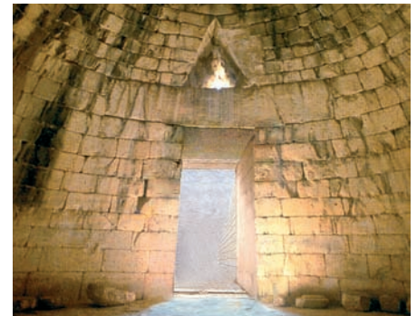
Tesoro di Atreo a Micene.