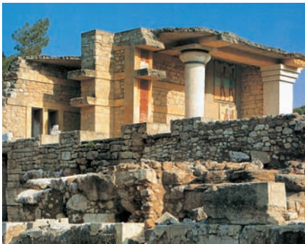
Palazzo di Cnosso.