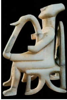
Suonatore di arpa.