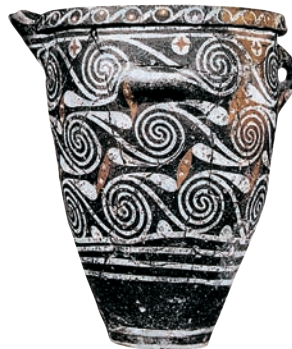
Brocca in ceramica dipinta.