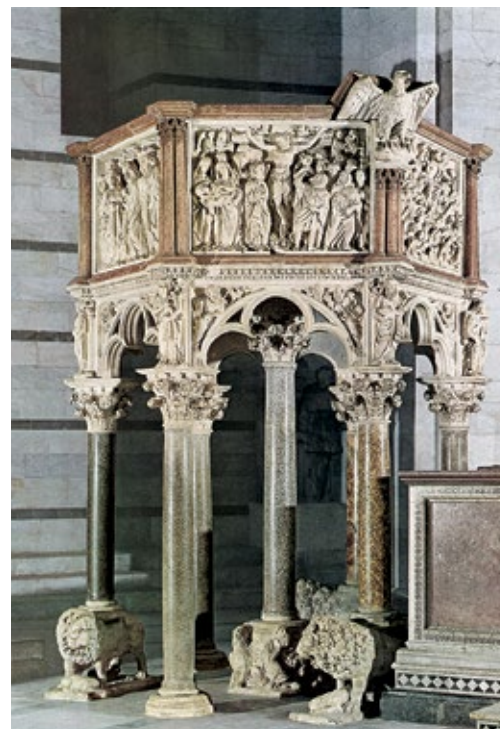
Nicola Pisano, Pulpito , 1260. Marmo, altezza 465 cm. Pisa, Battistero.

Le posizioni dei corpi non sono più rigide e massicce, come in età romanica, ma sinuose e spontanee. I gesti ed i volti sono fortemente espressivi. Nei gruppi di figure si cerca l'equilibrio tra gesti e posizioni reciproci.