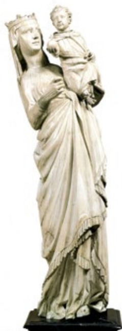
Giovanni Pisano, Madonna con bambino , 1298.