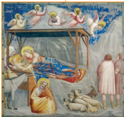
Giotto, La natività di Gesù , 1303. Padova.