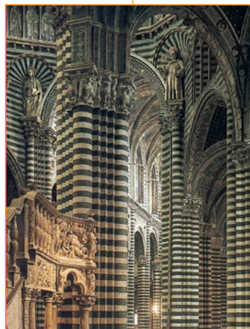
Duomo di Siena, interno, 1230.