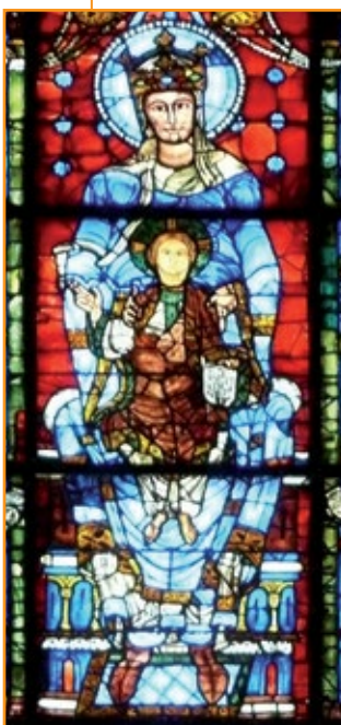
Vetrata della Cattedrale di Chartres, 1220. Francia.