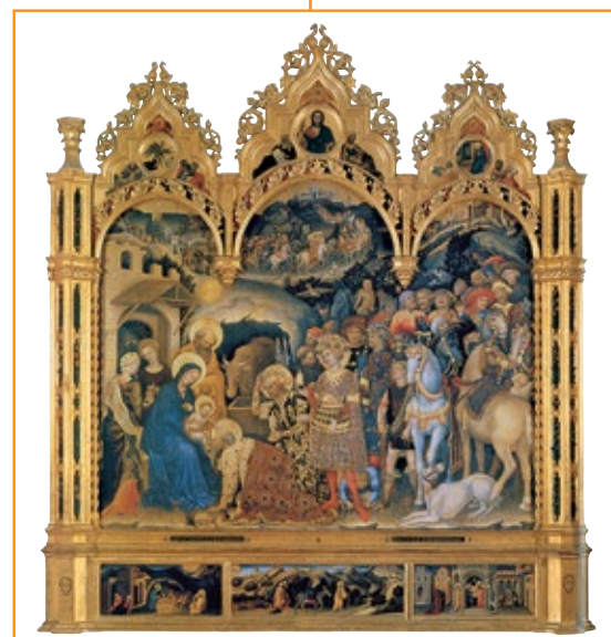
Gentile da Fabriano, Adorazione dei Magi , 1423.