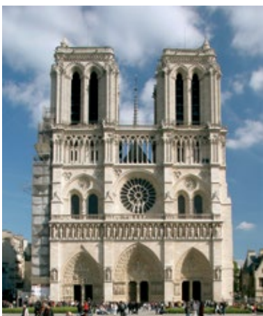
Facciata della Cattedrale di Notre-Dame, Parigi.

La cattedrale, proiettata verso l'alto, è rappresentazione della città celeste. L'uomo si perde al suo interno: i suoi spazi, inondati di luce, non sono misurabili.