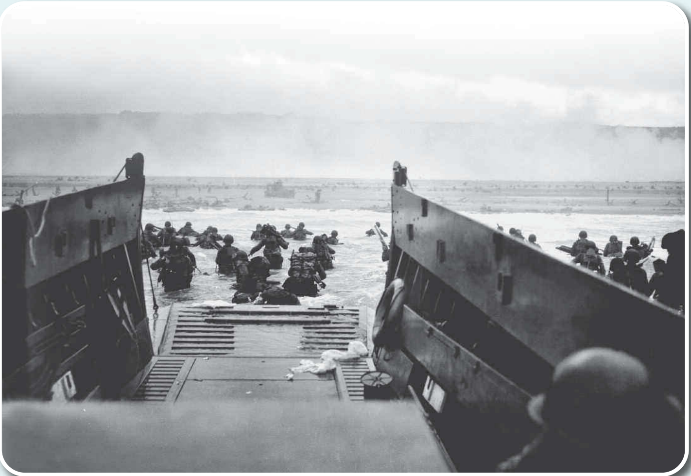
Sbarco in Normandia (6 giugno 1944).