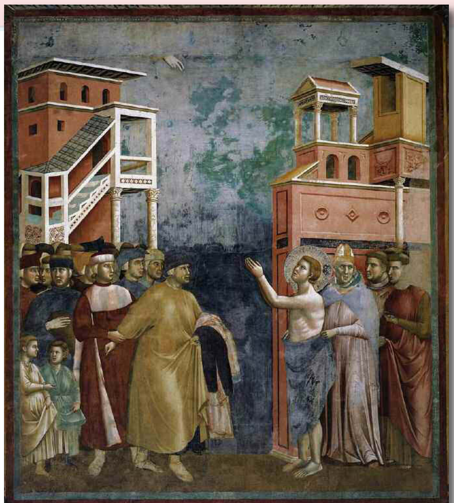
Giotto, Francesco rinuncia ai beni terreni , Basilica Superiore, Assisi.

Giovanni di Pietro Bernardone (detto "Francesco" per i frequenti commerci di suo padre con la Francia e per la madre di origine francese) nacque nel 1182 ad Assisi. Dopo aver trascorso una giovinezza agiata e spensierata, attraversò una profonda crisi spirituale che lo spinse ad abbandonare la famiglia e tutte le sue ricchezze per mettersi a servizio di Dio e delle persone più povere. In breve tempo egli raccolse intorno a sé numerosi seguaci, che accettarono il suo stile di vita basato interamente sugli insegnamenti del Vangelo: in particolare la pratica della povertà, il servizio agli altri – soprattutto i più miseri – e lo spirito di fratellanza.