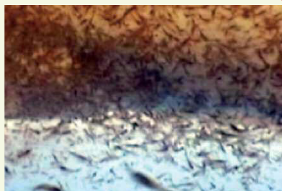
Fig. 5. Piccola porzione di un enorme sciame di Euphausia superba .