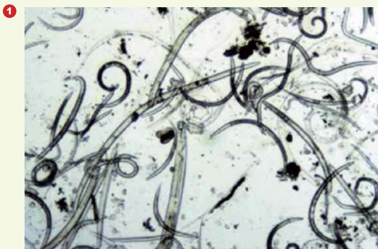
Fig. 1. Nematodi provenienti da una cucchiata di terra: i più lunghi misurano poco meno di 2 mm.

Sono i Nematodi (fig. 1). Vivono in tutti gli ambienti ma affollano soprattutto i centimetri più superficiali del suolo: ogni metro quadrato di terra ospita, mediamente, circa 2 milioni di questi microscopici vermi, lunghi mediamente poco meno di 1 mm. Calcolando la superficie delle terre emerse (escludendo i de-