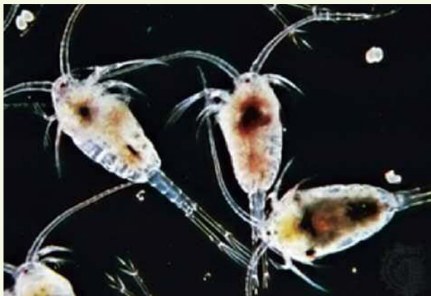
Fig. 2. Copepodi lunghi poco meno di 1 mm.

nel suolo) (fig. 4), le Formiche (il cui peso complessivo supera quello di tutti gli uomini messi insieme) e, in ambiente marino, il krill . Krill è il termine usato dai pescatori norvegesi per indicare il contenuto stomacale dei pesci e delle balene. Scientificamente parlando si tratta di Eufasie , crostacei lunghi generalmente 2-6 cm e simili a gamberetti, che in tutti gli oceani formano enormi sciame contenenti anche più di 40 000 individui per metro cubo. Sono il principale alimento di molti pesci, pinguini e balene. La specie più importante, Euphausia superba (fig. 5), costituisce una biomassa di 500 milioni di tonnellate considerate una delle più importanti riserve di proteine che ci siano al mondo.