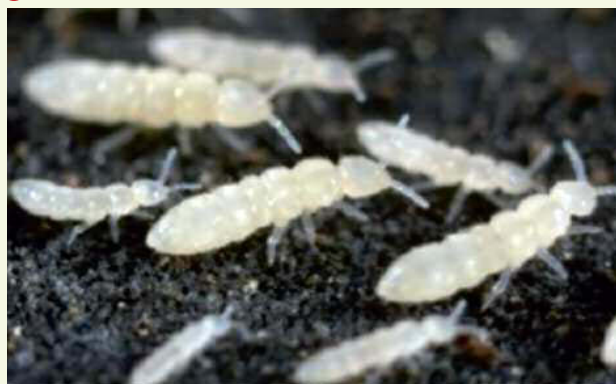
Fig. 4. Collemboli: sono considerati gli insetti viventi più primitivi.

Il secondo gruppo di animali più numerosi è costituito dai Copepodi , piccoli crostacei lunghi solitamente 1-2 mm, comunissimi nei mari e nelle acque dolci (fig. 2). In tali ambienti, mediamente, non vi è litro d'acqua che non ospiti almeno un copepode. Calcolando la loro densità negli oceani, si stima che ve ne siano 10^{18} . Si tratta di un dato importante, perché questi crostacei sono una parte essenziale delle catene alimentari: costituiscono infatti il nutrimento principale per molti pesci ed altri animali acquatici. Senza i copepodi l'ecologia marina sarebbe completamente diversa.