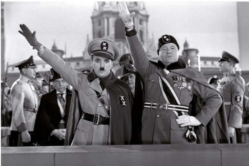
Figg. 1, 2 Due scene dal film Il Grande Dittatore dell'attore e regista britannico Charlie Chaplin: sopra, i dittatori Adenoid Hynkel (Charlie Chaplin, a sinistra) e Bonito Napoloni (Jack Oakie, a destra); sotto, Charlie Chaplin nei panni del dittatore Adenoid Hynkel mentre gioca grottescamente con il mappamondo, lusingato dall'idea di avere "tutto il mondo in pugno".

Chiunque abbia visto Il Grande Dittatore , il primo film sonoro di Charlie Chaplin , non può dimenticare la scena in cui il dispotico quanto demenziale Adenoid Hynkel, chiuso nelle stanze del suo potere, gioca con un mappamondo – e dunque simbolicamente con i popoli che intende sottomettere – facendolo rimbalzare e lanciandolo in aria come un pallone.