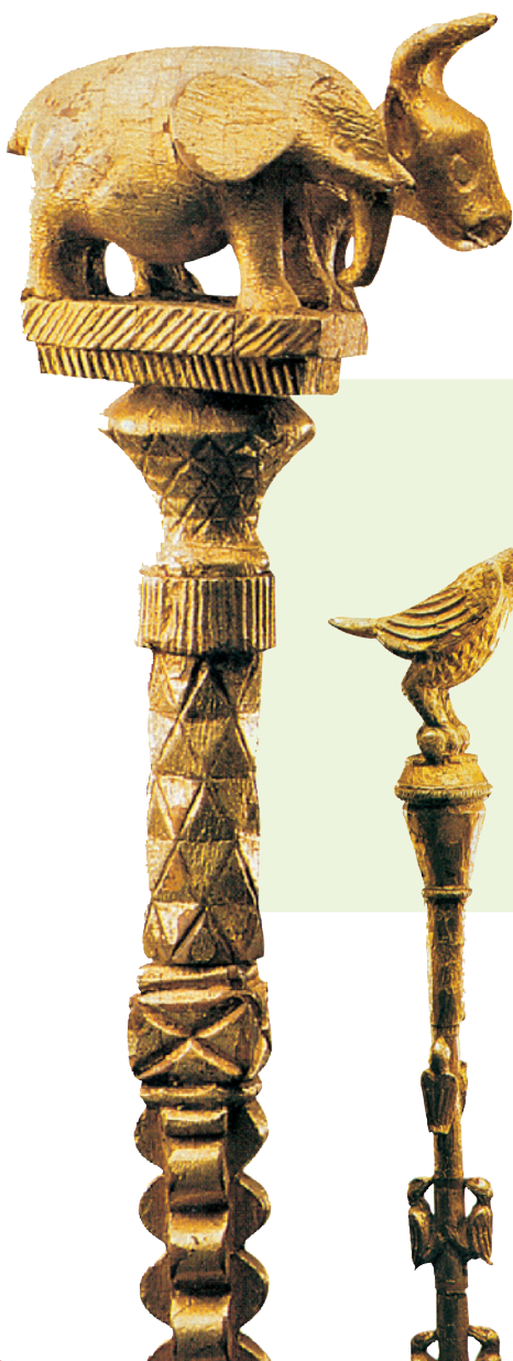
Trofei d'oro degli Ashanti.

Grazie ai Berberi, la religione islamica si diffuse velocemente anche nella regione subsahariana, dove giungevano le loro carovane per scambiare il sale , molto ricercato, con oro e schiaivi , destinati ai mercanti europei. Nelle regioni centrali e meridionali del continente esistevano popolazioni che avevano dato vita a numerosi regni e imperi (Ghana, Soso, Mali, Songhai, Kanem-Bornu, Monomotapa), la cui conoscenza da parte degli Europei avvenne lentamente e proseguì nei secoli successivi. Alle esplorazioni si opponevano , infatti, grandi barriere naturali , come il vasto deserto del Sahara e le impenetrabili foreste tropicali.