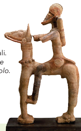
Cavaliere del Mali. Scultura databile intorno al XIV secolo.