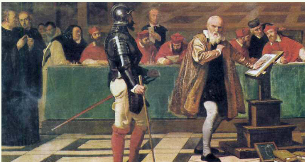
1. Galileo Galilei di fronte al tribunale dell'Inquisizione in un dipinto di Robert Fleury, Museo del Louvre, Parigi.

Riportiamo qui di seguito un brano del Dialogo sopra i due massimi sistemi , l'opera con cui Galileo Galilei impose alla tradizione di pensiero aristotelica il nuovo pensiero scientifico.