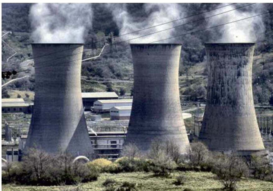
Fig. 2. Particolare della centrale geotermoelettrica di Larderello, con in primo piano alcune delle torri di raffreddamento dove condensa il vapore del circuito che alimenta il turboalternatore dell'impianto.

all'ingegnere e imprenditore francese F. J. de Larderel che, nella prima metà dell'Ottocento, mise a punto un sistema per lo sfruttamento dei soffioni boraciferi presenti in quella località, allo scopo di estrarre acido borico.