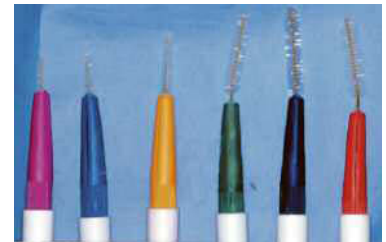
Fig. 1. a. Uso dello spazzolino. b. Uso del filo interdentale. c. Tipi diversi di scovolino.

È praticamente impossibile eliminare questi batteri, ma si può impedire la loro proliferazione e la loro attività, lasciandoli, semplicemente, senza cibo. Quindi basta ripulire la bocca da ogni residuo alimentare, lavando spesso i denti, possibilmente entro venti minuti dopo ogni pasto, dopo ogni caramella o dopo ogni bibita zuccherata. La carie non si sviluppa in rapporto alla quantità di zucchero ingerito (venti caramelle non lasciano in bocca maggiori residui zuccherini di una sola caramella), ma in proporzione al tempo di stazionamento in bocca dei residui alimentari. Perciò la pulizia dei denti fatta la mattina appena svegli è inutile: è invece indispensabile lavarli subito dopo colazione: i residui alimentari tra i denti vengono asportati dall'azione meccanica dello spazzolino (fig. 1a), del filo interdentale (fig. 1b) o dell'apposito scovolino (fig. 1c). Il dentifricio ha, invece, un'efficacia igienica pressoché trascurabile.